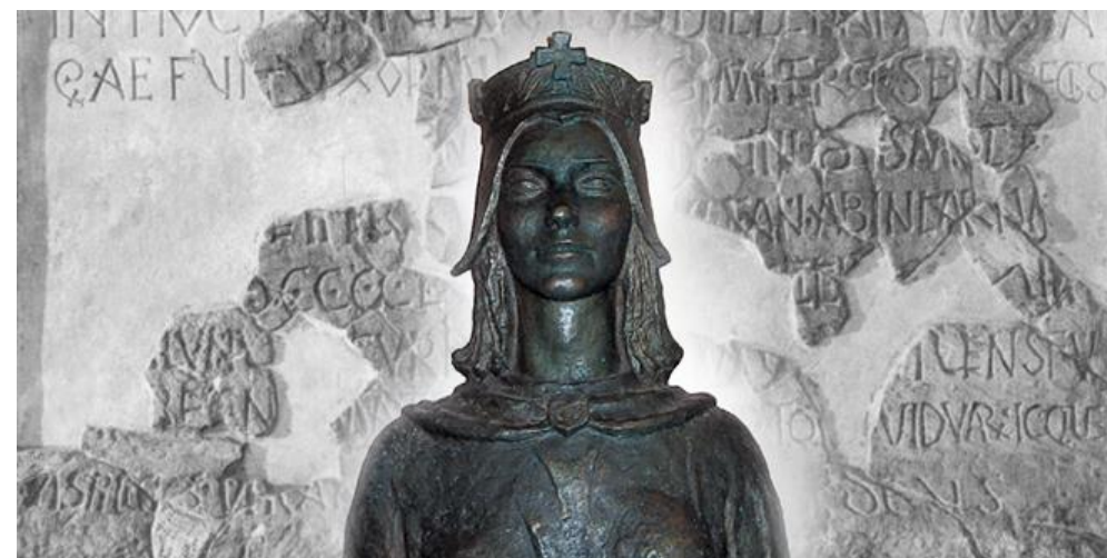
kraljica Jelena I.