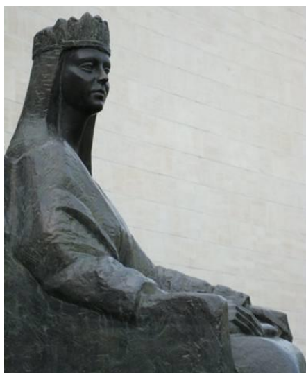
kip kraljice Jelene I.

U ovom grobu počiva glasovita Jelena koja je bila žena kralju Mihovilu i majka kralja Stjepana. Ona je postigla mir u kraljevstvu. Dana 8. listopada godine .... 976. ovdje je bila pokopana .... Ona, koja je za život bila majka kraljevstva, postala je majka sirota i zaštitnica udovica. Ovamo pogledavši, čovječe reci : „Smiluj joj se duši !”