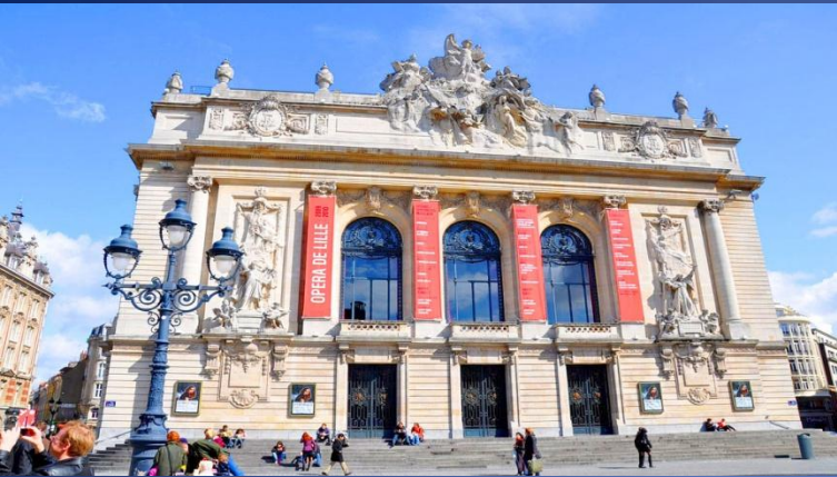
Place du Théâtre avec l'Opéra