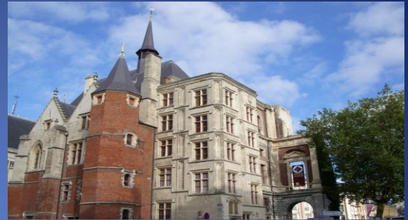
Palais Rihour , monument gothique du XV e siècle qui abrite aujourd'hui l'office de tourisme.

Palais des Beaux-Arts , deuxième musée de France après le Louvre pour la richesse de ses collections, abrite de prestigieuses collections de peintures, sculptures, dessins et céramiques.