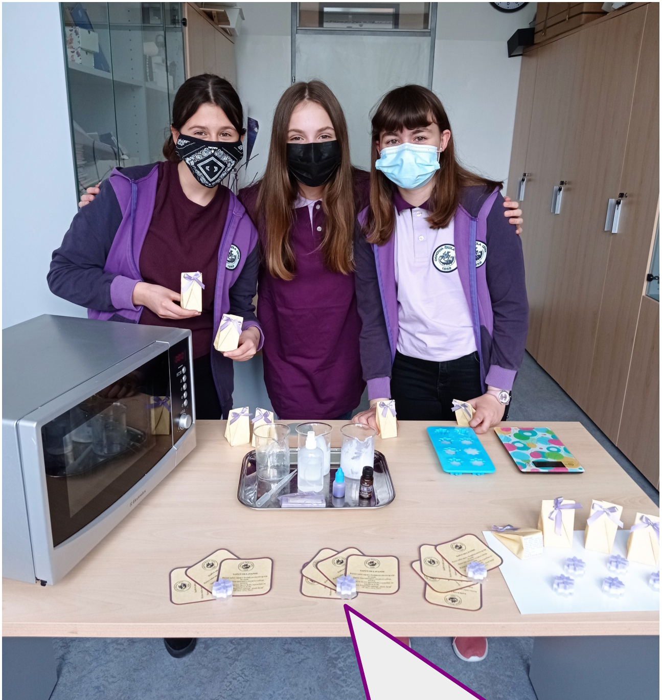
Pripremile i izradile učenice Učeničke zadruge „Sveti Juraj“ Osnovna škola Odra Svibanj 2021.