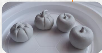
IZRADA FIGURICA OD GLINAMOLA