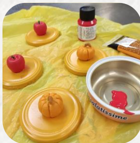
LJEPLJENJE FIGURICA NA POKLOPCE I BOJANJE