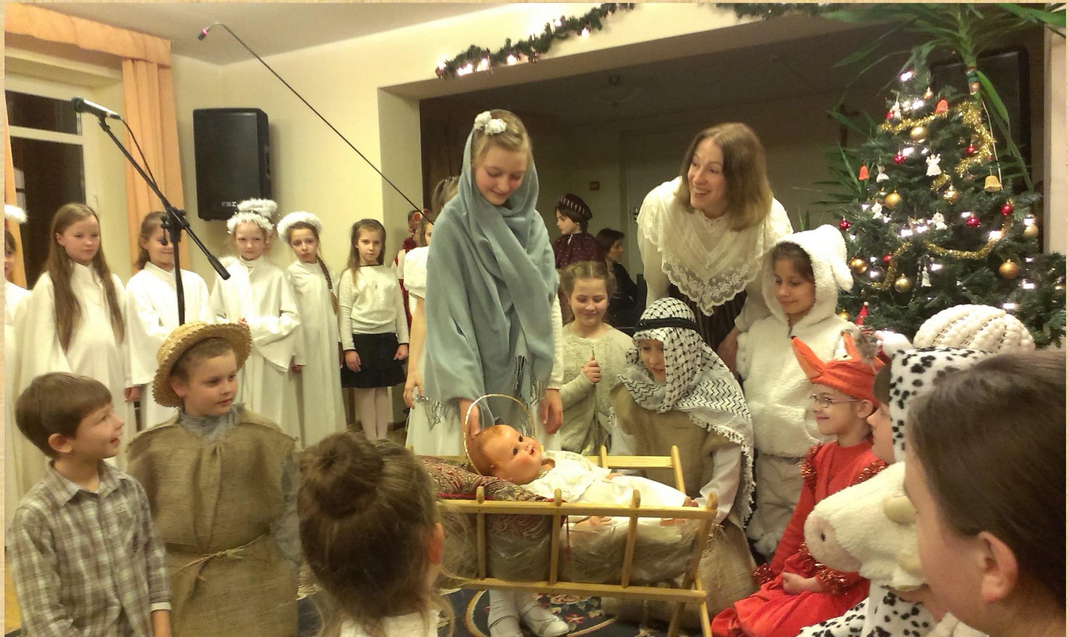
Kalėdinis Jaunučių (1-2 kl.) choro koncertas-inscenizacija „Betliejaus žvaigždėlė“