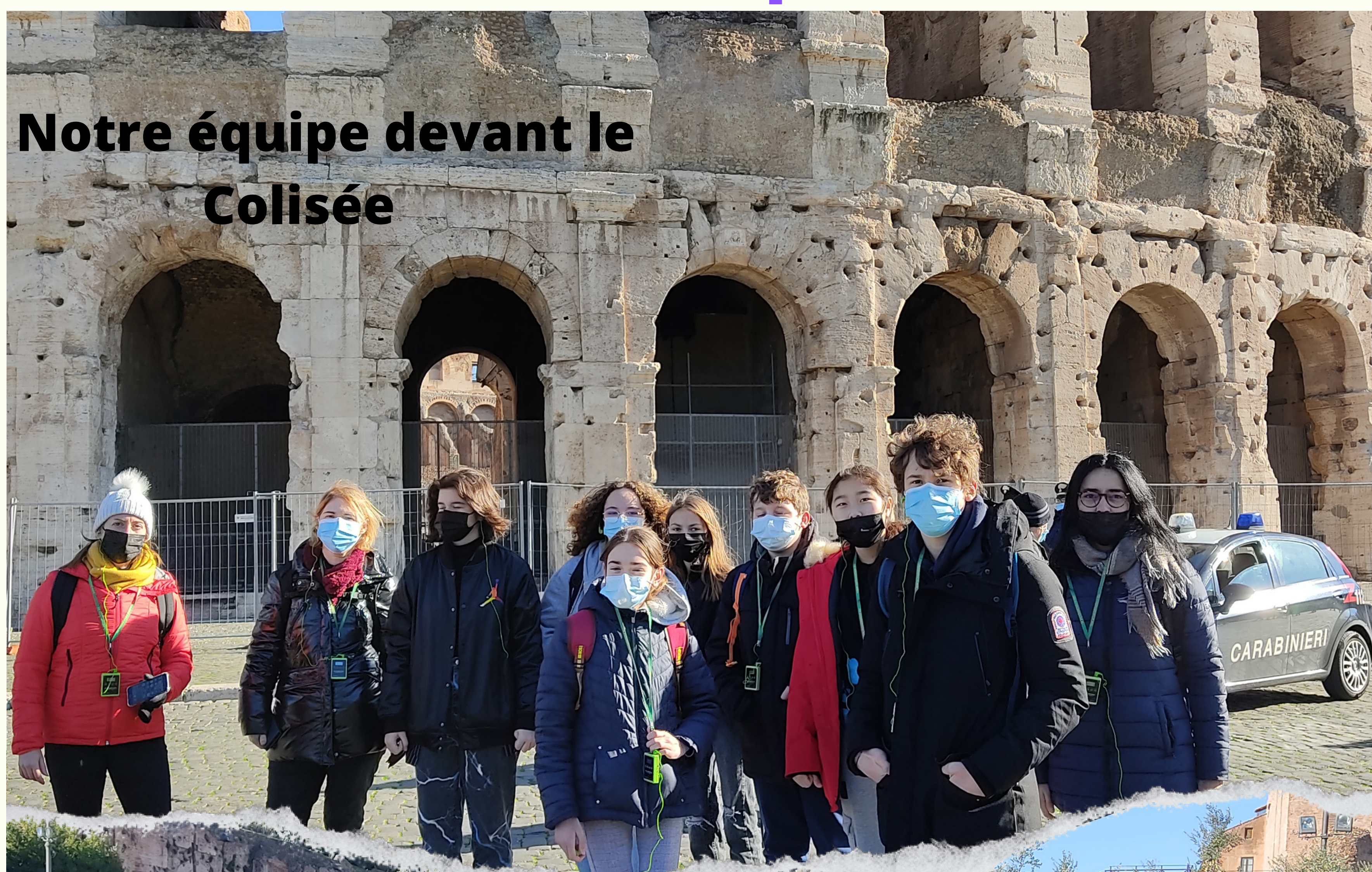
Notre équipe devant le Colisée