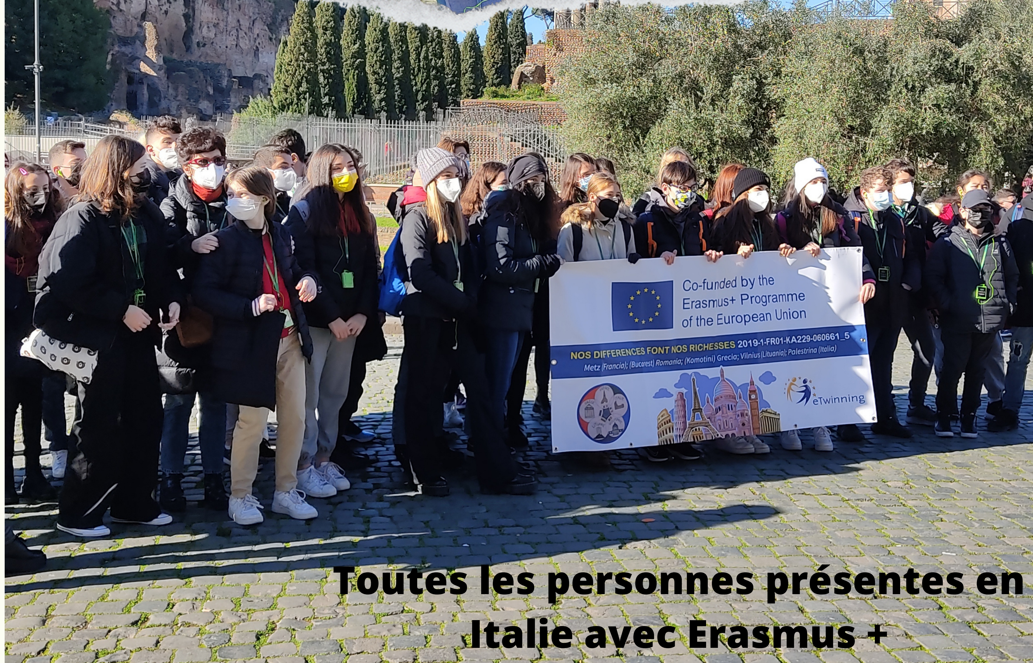
Toutes les personnes présentes en Italie avec Erasmus +