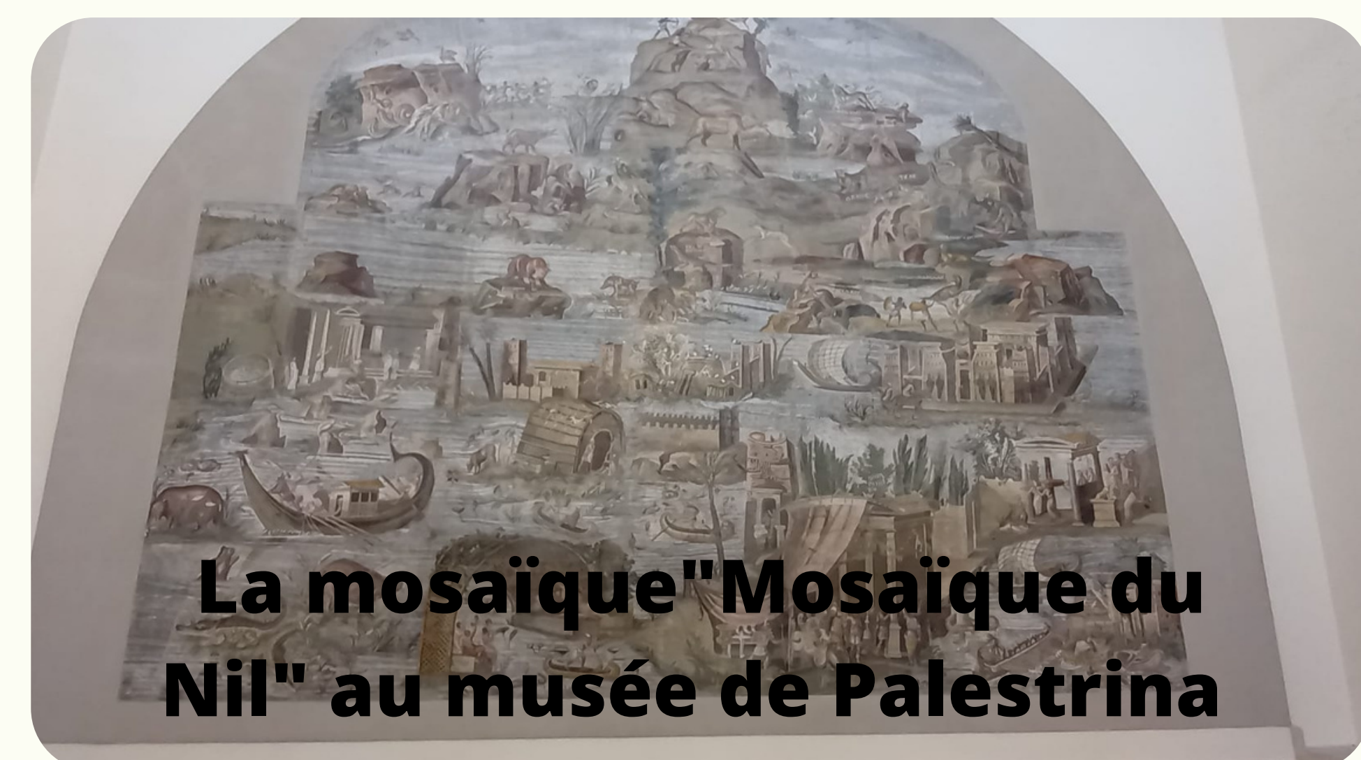
La mosaïque "Mosaïque du Nil" au musée de Palestrina