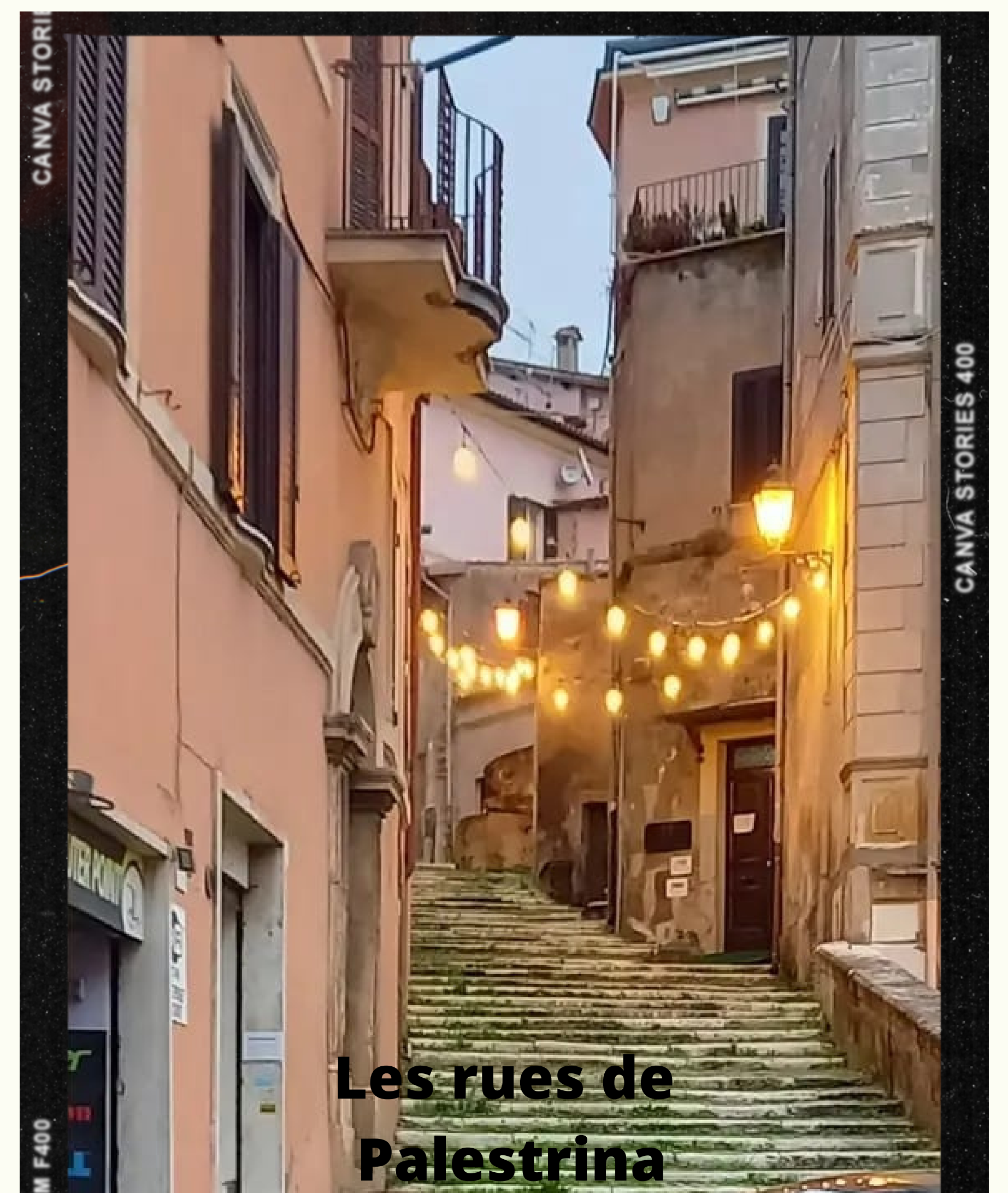
Les rues de Palestrina