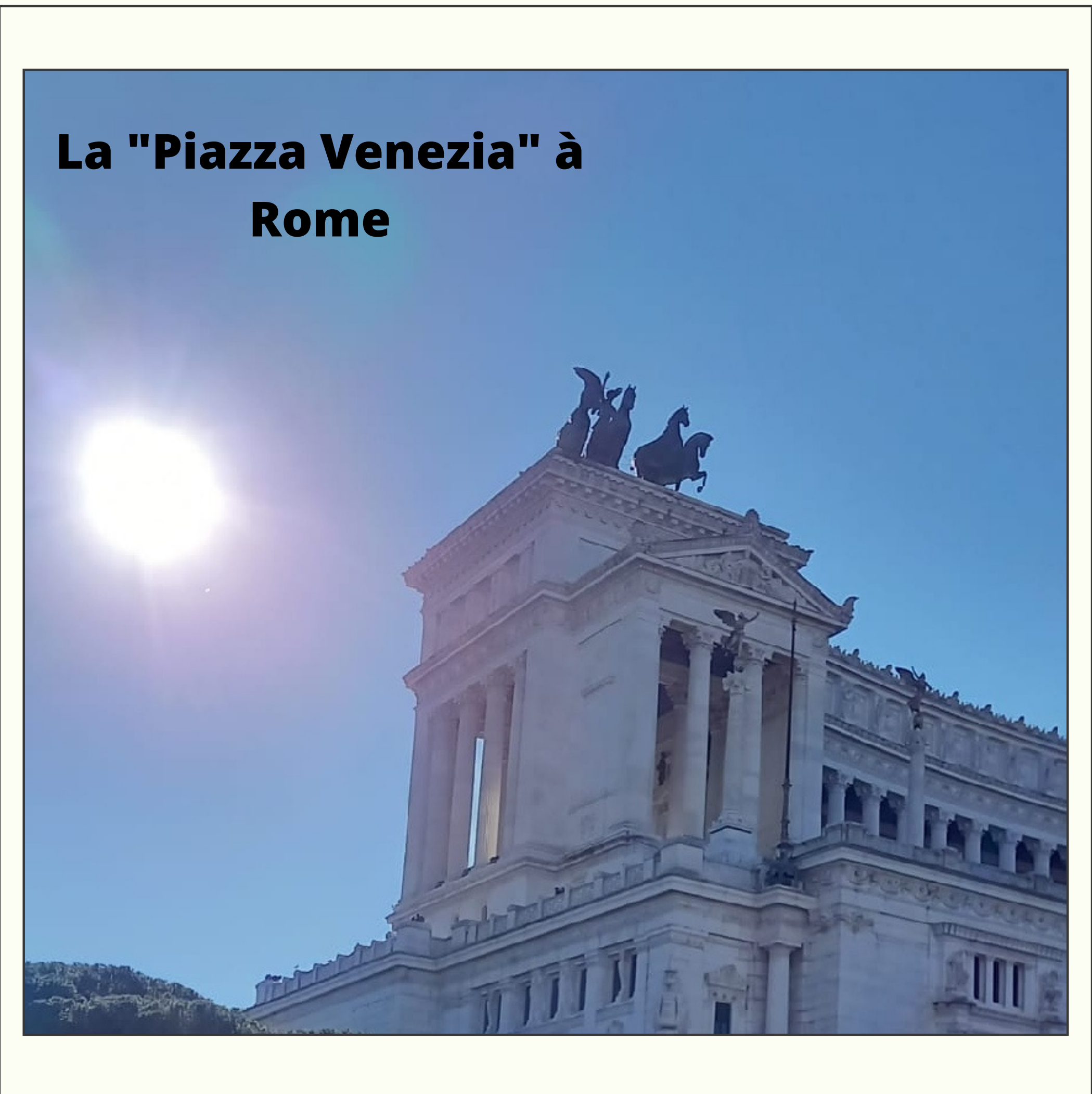
La "Piazza Venezia" à Rome

Du 28 novembre au 3 décembre 2021, nous étions en semaine d'apprentissage à Palestrina (près de Rome), en Italie. Nous avons vu la fontaine de Trevi, le Colisée, le Forum romain et beaucoup d'autres sites historiques et culturels. Nous avons aussi participé à de nombreuses activités et rencontré des Italiens, des Grecs, des Lituanieniens et des Roumains. (plus de détails page 2)