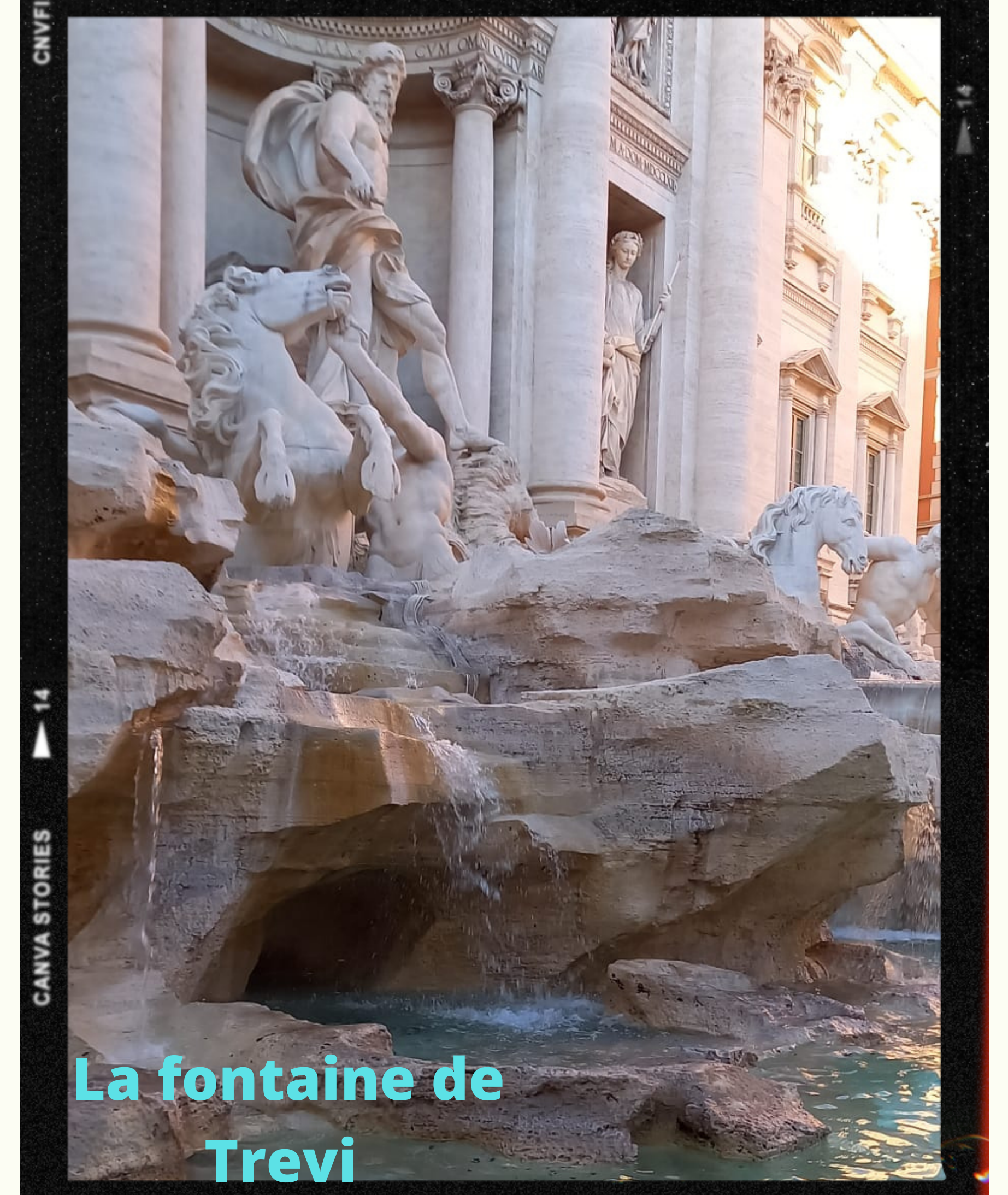
La fontaine de Trevi