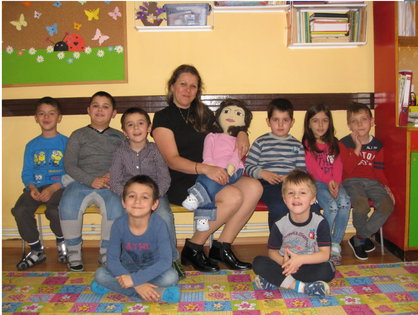
Group Violet 6-7 year olds