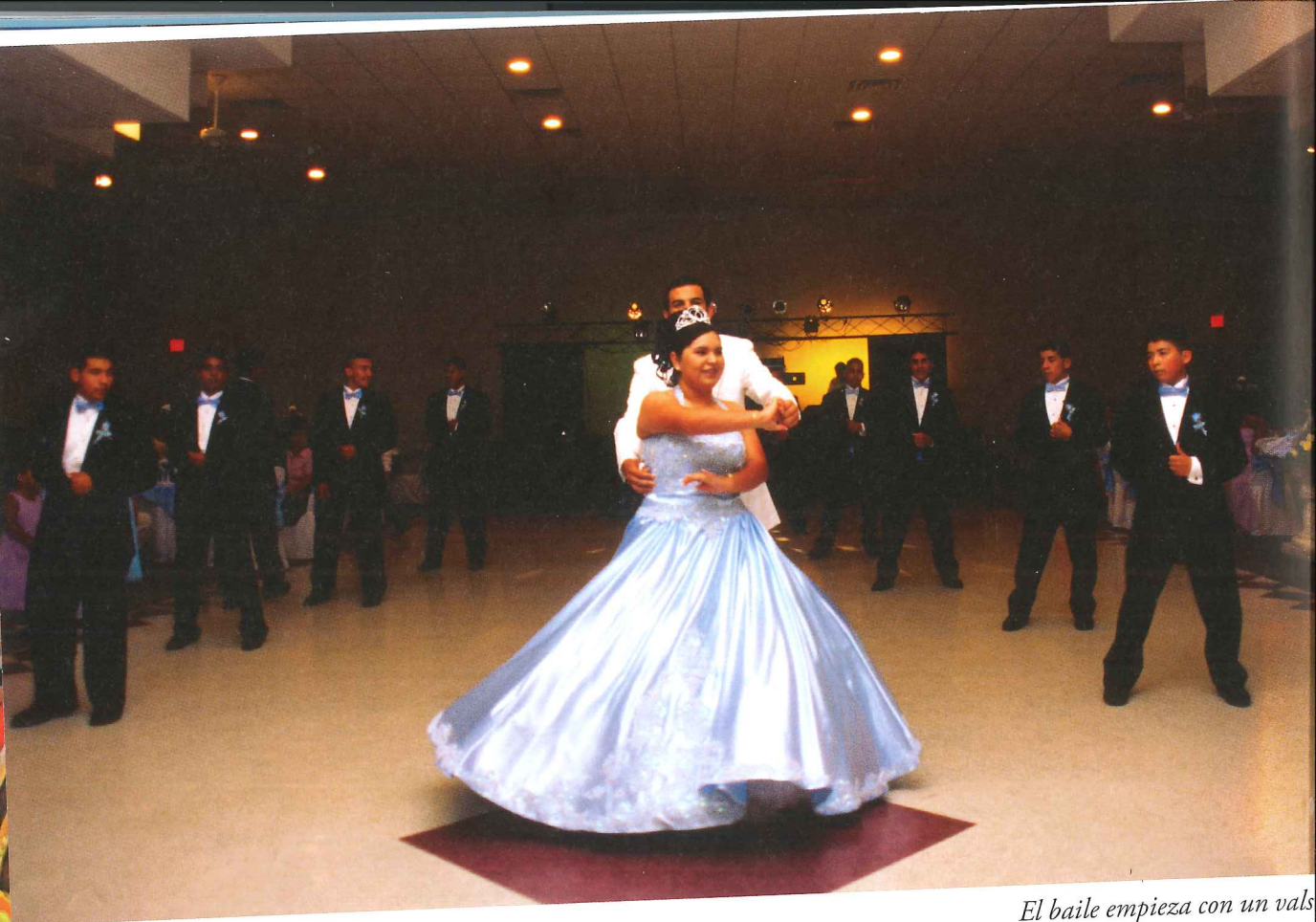
El baile empieza con un vals

En familias católicas la ceremonia suele empezar en la iglesia con una misa de Acción de Gracias. Después sigue "el banquete" en casa, en un salón de fiesta o en un restaurante. Es una fiesta con la familia e invitados. Se come, se dan los regalos a la quinceañera y se baila.