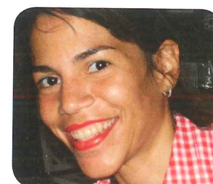
Ana Esperanza de Venezuela: Eligió .....

eligieron de valde eligió hon valde el celular mobil/telefon/ (lat.am.) el carro bil (lat.am.) sencillo enkel la camisa de cuadros rutig skjorta