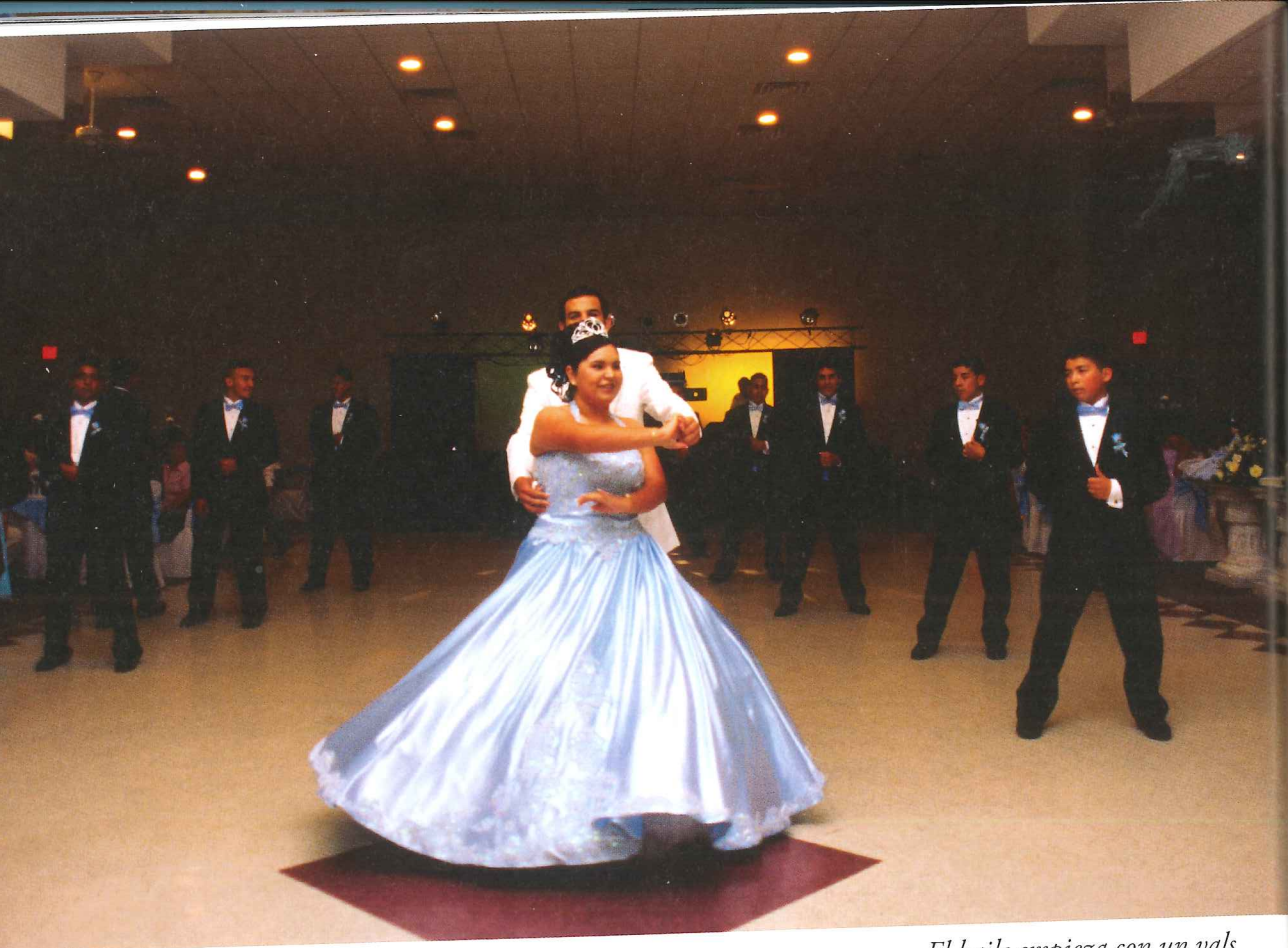
El baile empieza con un vals

En familias católicas la ceremonia suele empezar en la iglesia con una misa de Acción de Gracias. Después sigue "el banquete" en casa, en un salón de fiesta o en un restaurante. Es una fiesta con la familia e invitados. Se come, se dan los regalos a la quinceañera y se baila.