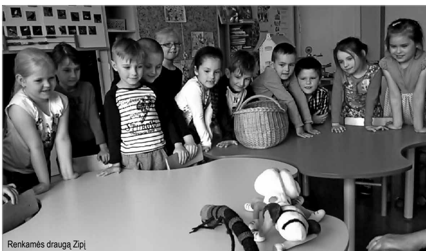
Renkamės draugą Zipį

Mano darbo su šešiamečiais praktika ir patirtis rodo, kad sėkmingas priešmokyklinės programos įgyvendinimas daugiausia remiasi paveikia ankstyvosios prevencijos programa. Tad jau 10 metų Kėdainių r. Vilainių mokyklos-darželio „Obelėlė“ priešmokyklinukams geriausias draugas yra Zipis. „Zipio draugai“ – tai tarptautinė programa, visame pasaulyje pripažįstama kaip viena veiksmingiausių ankstyvosios prevencijos programų. Pagrindinis jos tikslas – išmokyti vaikus įveikti kasdienės bėdas ir ugdyti gebėjimą nugalėti sunkumus įvairiausiose situacijose visą gyvenimą. Lietuvoje „Zipio draugų“ programa įgyvendinama nuo 2000 m. Man ši programa patraukli dėl dviejų priežasčių: pirma, turi aiškią struktūrą, bet kartu yra lanksti – galiu integruoti į kitas veiklas, pritaikyti savo idėjas, kūrybinius sumanymus, spontaniškas veiklas, įtraukti tėvus, antra, „Z“ kartos vaikus, kurių