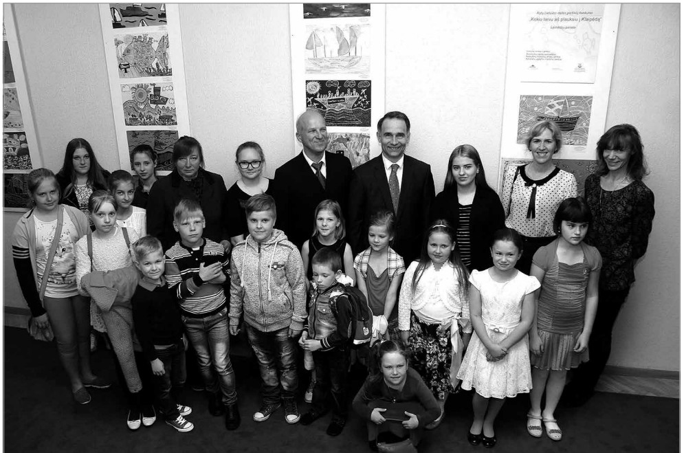
Per konkurso laureatų apdovanojimo ceremoniją LR susisiekimo ministerijoje

Švenčionių Juliaus Siniaus meno mokykla ir Lietuvos Respublikos susisiekimo ministerija vykde projektą-dailės piešinių konkursą „Kokiu laivu aš plauksiu į Klaipėdą“. Projekto pagrindinis tikslas – skatinti ugdymo įstaigų glaudesnę bendradarbiavimą ir dalijimąsi gerą patirtimi. Tikimasi įtraukti įvairių mokymosi institucijų mokinius į aktyvią gamtos saugos veiklą, formuoti atsakingą požiūrį į saugų vidaus vandenų naudojimą ir išsaugojimą ateities kartoms. Konkurse dalyvavo Rytų Lietuvos mokyklų 7–18 metų mokiniai. Partneriais pakviesti tapti Susisiekimo ministerija, Kaltanėnų ugdymo ir turizmo centras, Reškutėnų tradicinių amatų