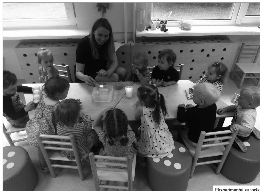
Ekspperimentai su vašku

kartinių popierinių lėkštelių, vaidino lėlių teatrą, kuris padėjo suprasti ir įsijausti, kaip sugyvena skirtingų rūšių gyvūnai, kuo jie skiriasi, kuo minta ir pan. Naminių gyvūnų tema itin artima dvimečiams vaikučiams. Retas iš jų jau geba kalbėti, todėl gyvūnų skleidžiami garsažodžiai padeda lavinti mažųjų kalbą.