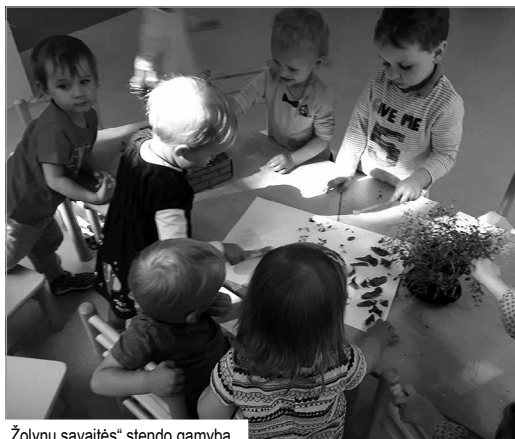
„Žolynų savaitės“ stendo gamyba

Aptarę ir įtvirtinę žinias apie sveikatą, kitą savaitę mažieji pradėjo pažintimi su naminių gyvūnais. Per mankštą atliko judesius, imituojančius įvairius naminius gyvūnėlius, vėliau apie juos klausėsi dainelių ir pasakų. Mažieji mokėsi atpažinti ir atkartoti gyvūnų skleidžiamus garsus. Auklėtojos pasakojo apie gyvūnų naudą žmogui ir būtinybę juos saugoti. Vaikai gamino įvairių gyvūnėlių kaukes iš vien-