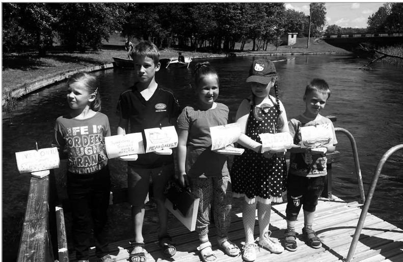
Pasiruošę plukdyti laivelius Žeimenos upe