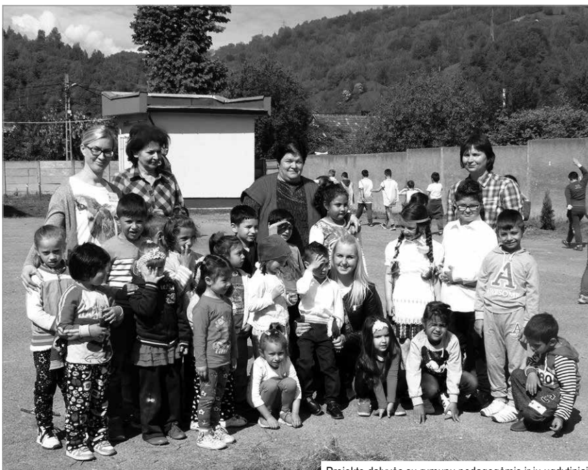
Projekto dalyvės su rumunų pedagogėmis ir jų ugdytiniais