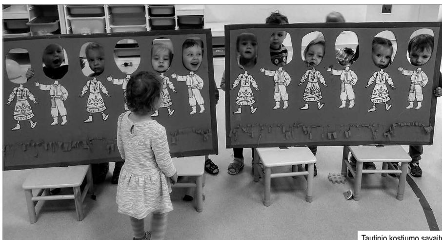
Tautinio kostiumo savaitė