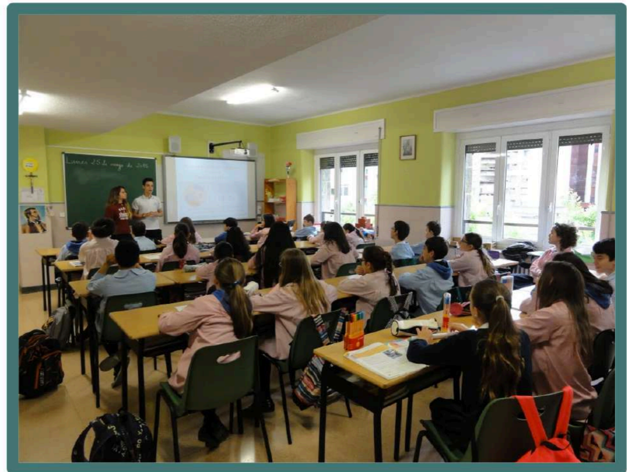
Alumnos del Colegio Nuestra Señora del Huerto de 3º de ESO educando a los más pequeños