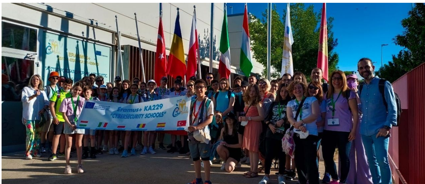
Visita de los alumnos internacionales del proyecto Erasmus.

Un grupo de alumnos procedentes de Hungría, Rumanía, Polonia, Italia y Turquía han visitado esta semana la ciudad para intercambiar experiencias sobre ciberseguridad con los estudiantes del colegio Ciudad de Mérida