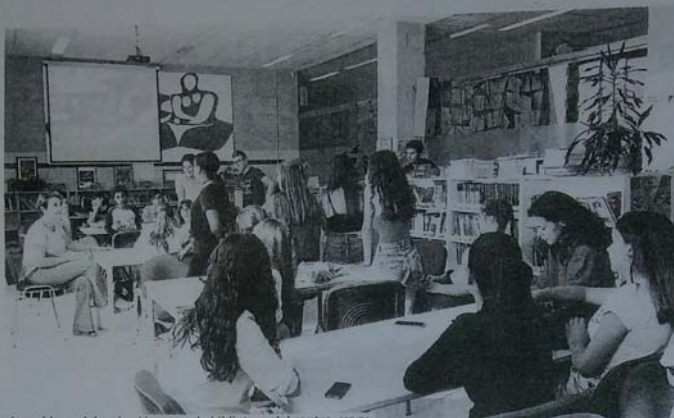
Asamblea celebrada el lunes en la biblioteca del centro.