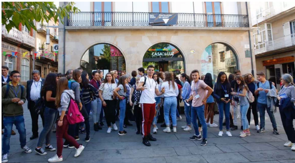
▲ Pontevedra recibe a alumnos de cuatro países. https://www.lavozdegalia.es/noticia/pontevedra/pontevedra/2018/10/23/pontevedra-recibe-alumnos-cuatro-paises/0003_201810P23C7999.htm#