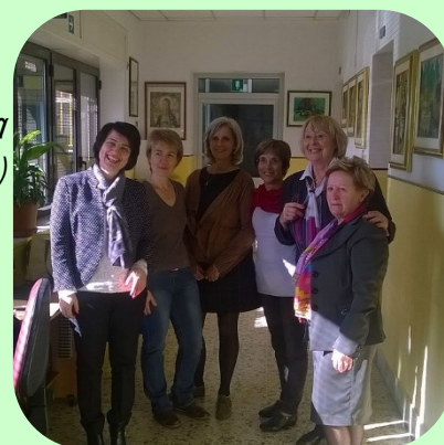
Projet ERASMUS+ KA1 : Les délégations françaises et italiennes à Muro Lucano, Italie (Novembre 2016)