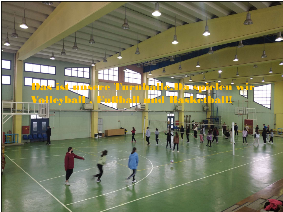
Das ist unsere Turnhalle. Da spielen wir Volleyball, Fußball und Basketball!