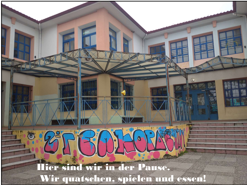
Hier sind wir in der Pause. Wir quatschen, spielen und essen!