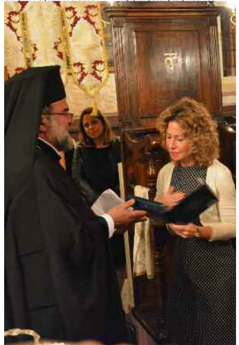
Εκκλησιών εις την Ανατολή αλλά και την Δύση, καθώς και εις παν άλλο πρόβλημα το οποίο ταλανίζει τον σύγχρονον κόσμο.» Στη συνέχεια ο Αρχιεπίσκοπος Νεκτάριος παρέδωσε στον