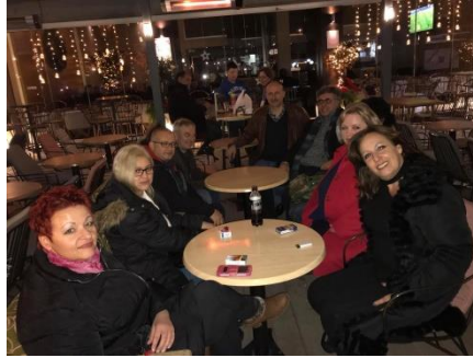
Καλωσόρισμα στην πόλη της Θήβας