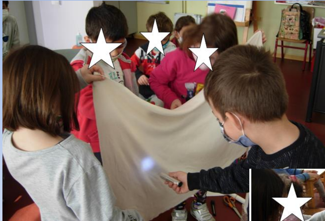
Πειραματιστήκαμε για τη δημιουργία αυτοσχέδιου Θεάτρου Σκιών