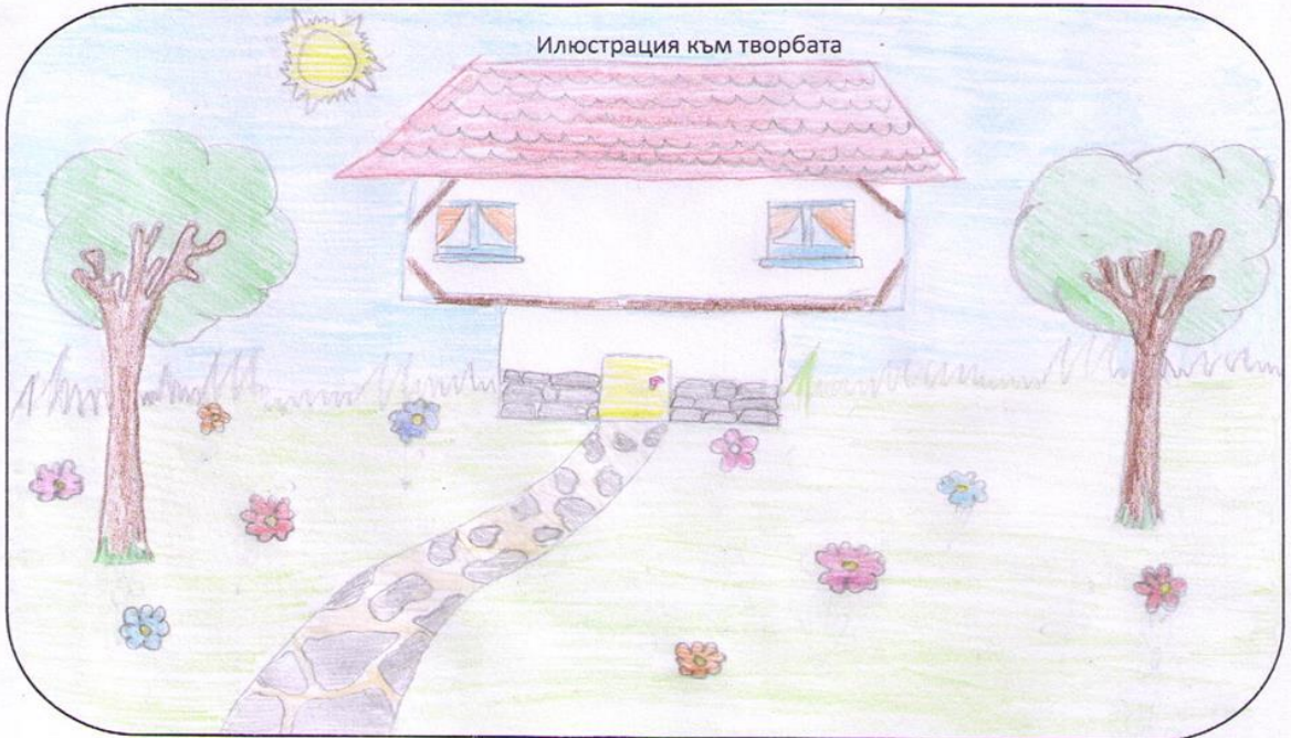
Илюстрация към творбата

Квалцурка на ордите златни, хът свиден и мил! И за царските палати не биа те сменни.