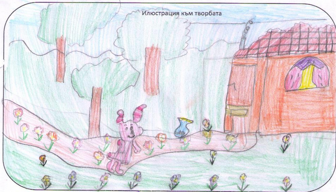
Илюстрация към творбата

Велики в Близката земя се почитваха за Денят на приятелството. Щеше да има много празнество с много дари, храна и забавление. Преди се отби при Лука и му позволиха да потърси гореленице с мед. Мелето бе талъва гурметство те си талъчихахме песничка. Мелето в харите ми малко, сладко, сладко!