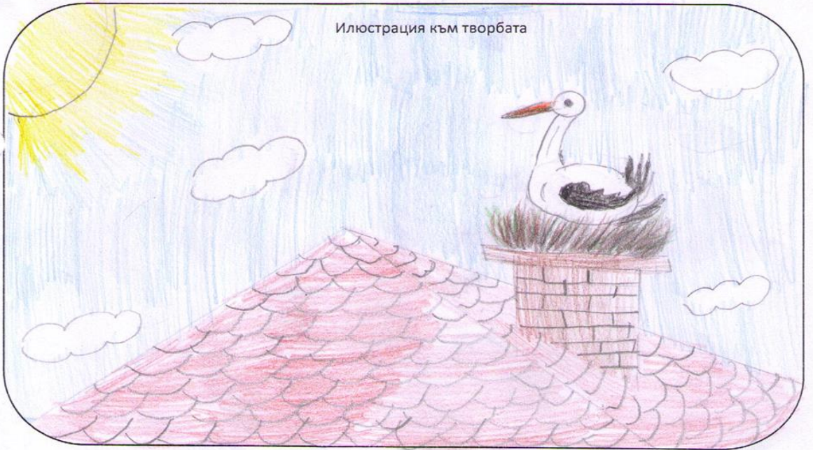
Илюстрация към творбата

Де ли защо ще вървя дръраде?... Защо се връщам всяка прелет?... Защо ще се върнете и бие пак на нас, му се навег таянат ветър и се раздвояват ролките мивадр?... Ще видите вие много страни, много пая и ривали, мрежата и те аналитич и ще разберете. Ще раз- берете, че нима де дръгата не е тъй хубавя, както тукя; и нима де те натак на муралиите, вилер колата полето далече, не е тъй радужноа; и нима де дръгата ия. Калитките не е тъй таят, таят е таят, дръгата не таят с прила натакте си.