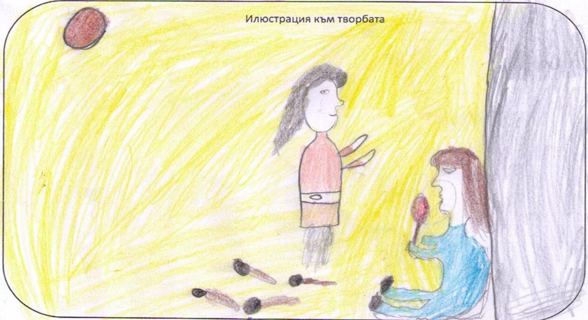
Илюстрация към творбата

Откъс от творбата, който най-много ме впечатли: Пожойката ми баба като единствена човек обичала ми казватки: „Като падне звезда, Нелма думи отива при Дна.“ Малката кметска проговарка о стелната нова кметска. Малката ми състипна дъ фарм пратранантното и пред детето застава, мила обкръжна със сядане, неговата кротка и малка баба, която излизатин такава четла и поизарна