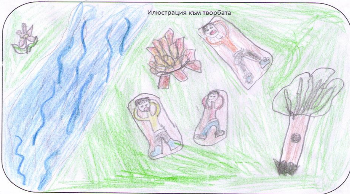
Илюстрация към творбата

От някакви дни по бреговете на реката скитаха трима иманяри. Беше се пръскал слух, че от асротам, който прекосял за Ундия Багажа на прогуд махараджа, паднало едно буре със стъпанцистите. Иманяриите тръгнаха из скалната и тайнитвено размитваха, даже открият следите на приказното богатство. Те калуваха край реката. Бяха си направили огън в едно приютено място и забив т стелки и мурици, лопата край огъня, отпадени на листи и раздвори.