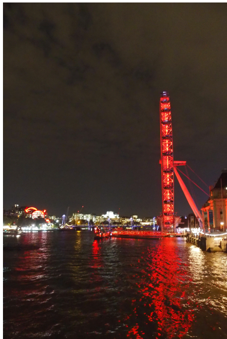
Promenade le long de South Bank

est radicalement moins onéreux et permet des progrès considérables. Cependant, l'implication dans le travail personnel demandé par les professeurs de TTI- mais dans les faits non exigés-m'obligeait à rapidement abandonner la famille pour me consacrer à mes exercices. Il faut toutefois souligner que j'avais choisi de réaliser tous les exercices demandés puisque je suis parti seul et que je n'étais donc pas perturbé par des civilités.