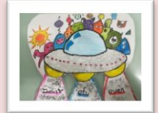
Our logo ----- Nuestro logo