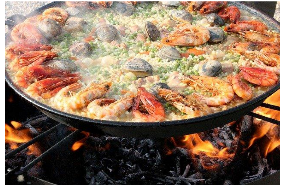
PAELLA DE LEÑA MIXTA