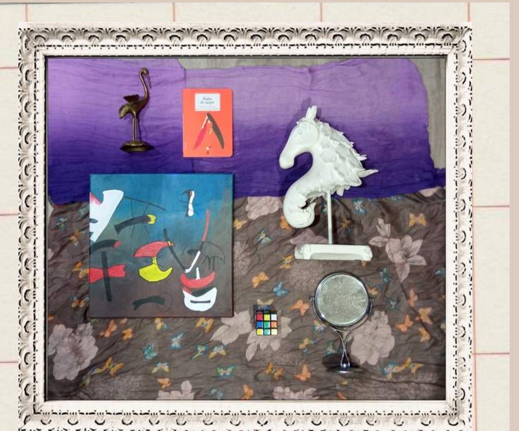
Knolling: El panel del Moderna

Este tipo de actividad individual era llevada a cabo al final de cada trimestre y en ella debíamos escoger una serie de objetos que encontrásemos por casa y que simbolizasen diferentes características o aspectos de cada uno de los territorios trabajados en clase. Posteriormente eran colocados sobre una superficie en ángulos rectos y debíamos tomar una fotografía de todo el panel. Finalmente, debíamos explicar que aspecto representaba cada elemento.