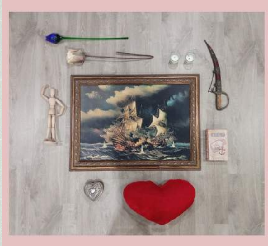
Knolling: El panel del Romántico

En mi caso, yo hice tres Knollings distintos siguiendo las pautas establecidas. En el primero reflejé las características propias del Romanticismo, en el segundo aquellas del Realismo y en el último, los aspectos principales de los Modernos.