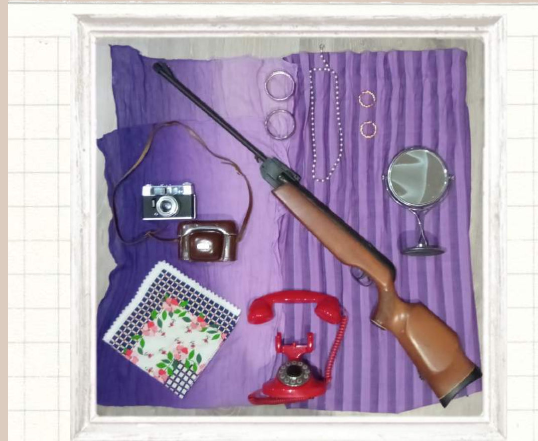
Knolling: El panel del Realista