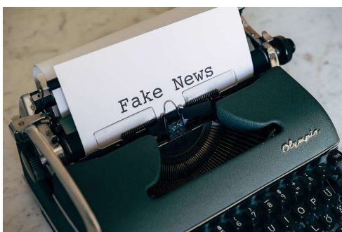
Fake News un phénomène nouveau ?