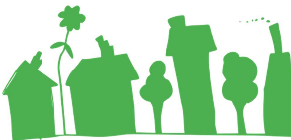
La ville verte, école de la gare, AC