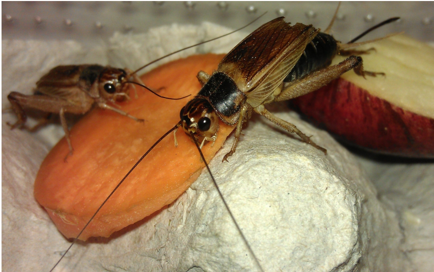
une tranche de carotte

La nourriture doit être variée pour les grillons en captivité : des feuilles de salade ou de choux, des morceaux de fruits ou de légumes frais, des croquettes pour animaux, des flocons pour poissons. Il est omnivore.