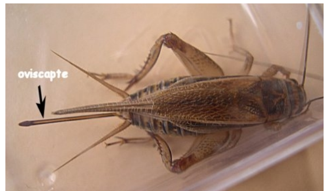
Le grillon femelle