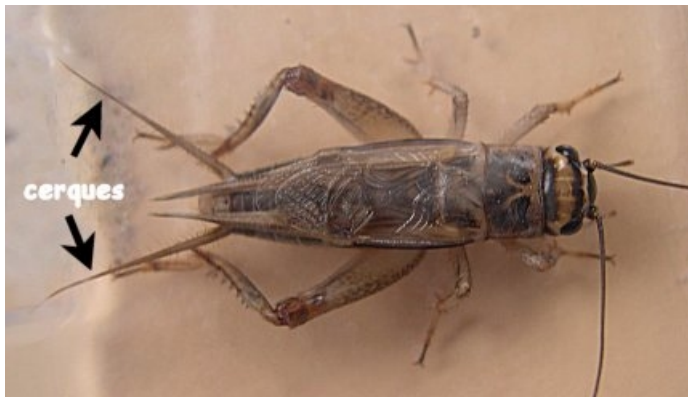
Le grillon mâle

Les grillons deviendront adultes après 6 à 8 semaines.