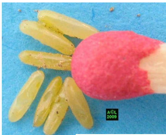
Quelques œufs de grillons