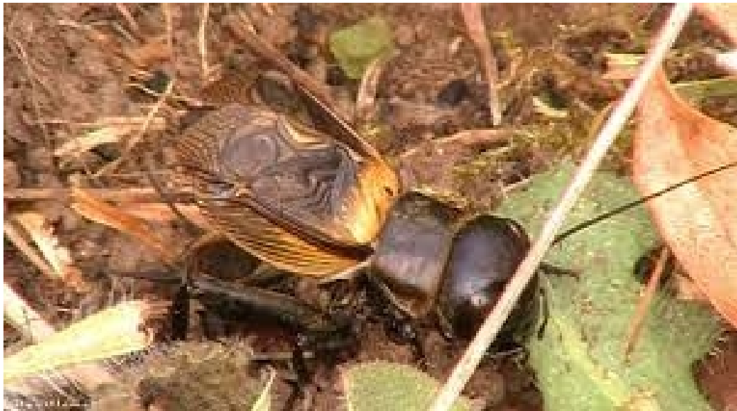
Le chant du grillon avec ses ailes ouvertes

https://www.youtube.com/watch?v=EHEYBP_06cM