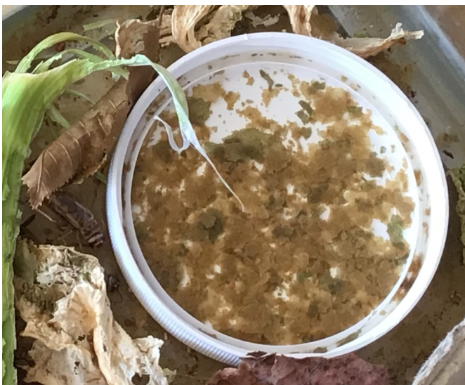
des flocons pour poissons