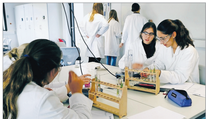
↑ Mädchen stark machen für Europa und Naturwissenschaften.