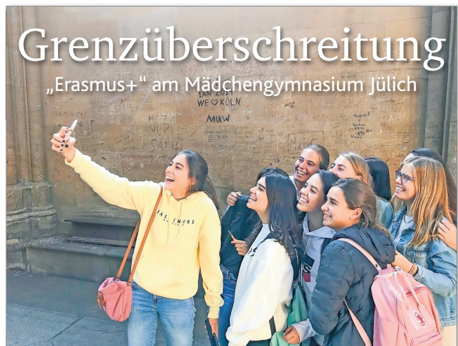
↑ Erasmus+: Weil Gemeinschaftsgefühl ein Auslöser ist.

80 45, www.st-ursula-gk.de . Tag der offenen Tür ist Samstag, 11. Januar 2020. Anmeldungen sind möglich am Freitag, 31. Januar 2020, am Samstag, 1. Februar 2020 und am Montag, 3. Februar 2020.