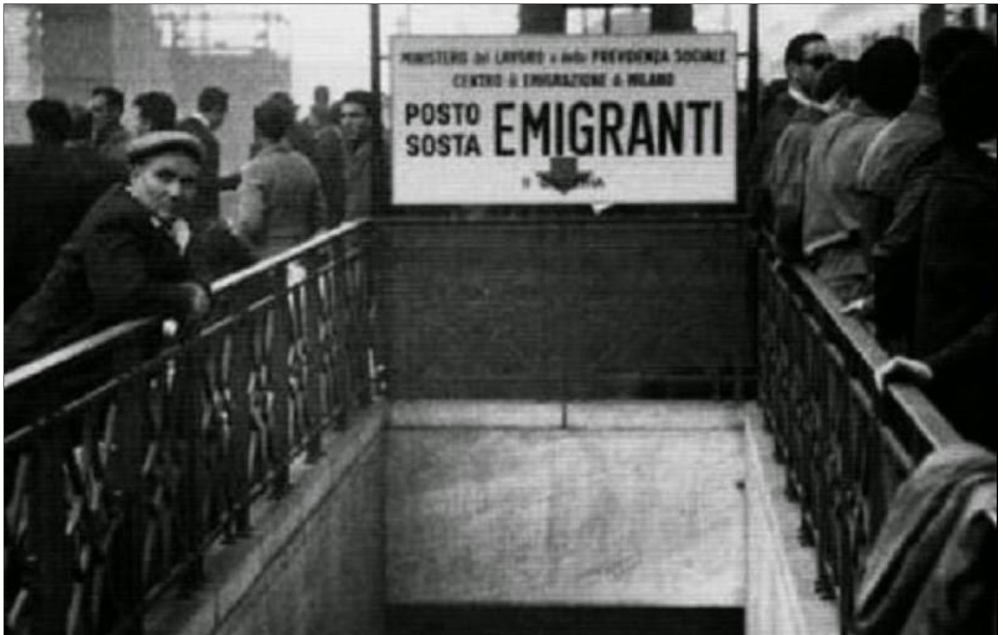
Centre d'émigration à Milan