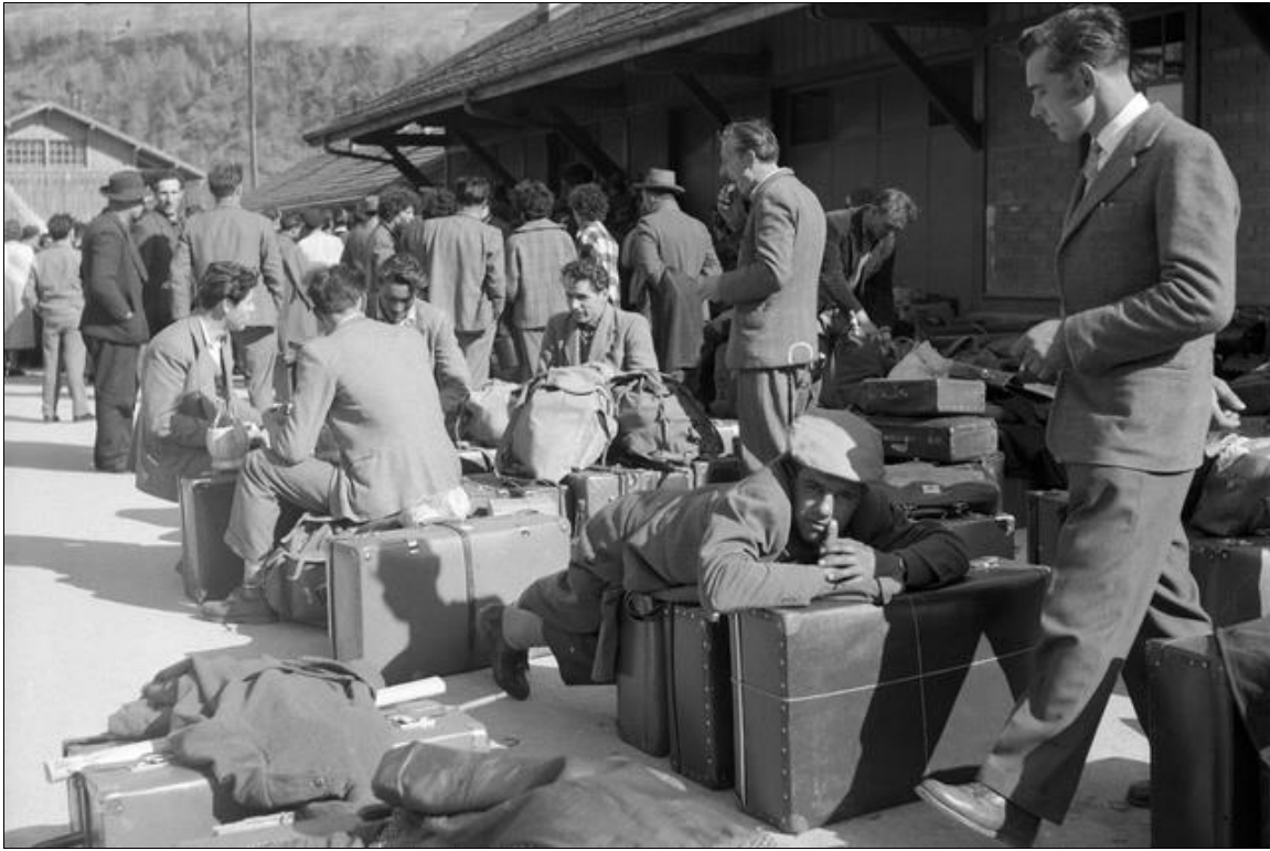
Canton du Valais : Emigrants italiens avec leurs valises en carton à la gare de Brig en 1956