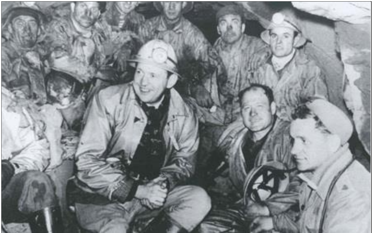
Groupe de mineurs italiens en Belgique