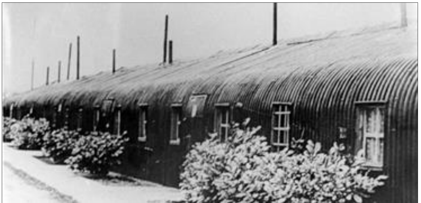
Baraquements de mineurs – Région de Liège