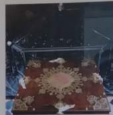
Geöffneter Glasschrein mit der 1891 geschaffenen Holzlade zur Aufbe- wahrung des Heiligen Rockes