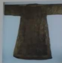
Heilig-Rock-Reliquie (Zustand 1996)