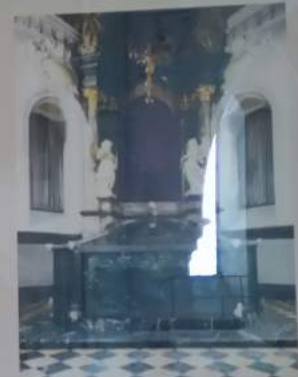
Blick in die Heilig-Rock-Kapelle nach der Neugesaltung 1974: Glasschrein mit der Holzlade, in der die Heilig-Rock-Reliquie aufbewahrt wird, darüber Hängekreuz (von Klaus Balke gefertigt 1974); barocker Altaraufbau, im Altarfeld Darstellung des Sternenhimmele vom 1. Mai 1974