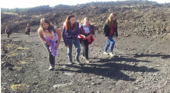
Hoja po Etni.