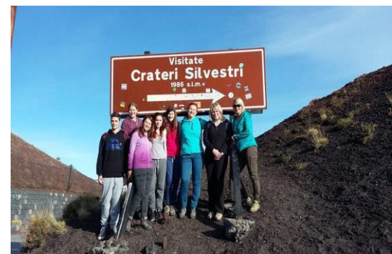
Slika skupaj z učiteljicami pri manjšem kraterju Etne.