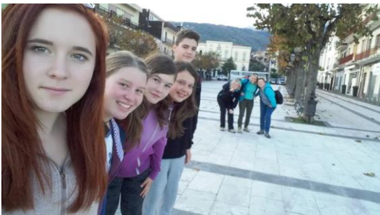
Sebek skupaj z učiteljicami.

Ogledali smo si tudi mesto, v katerem je bilo to čebelarstvo podjetje. Mesto je blizu morja in je zelo urejeno. Večina ljudi živi v blokih ali večstanovanjskih hišah. Zelo na hitro smo se lahko sprehodili po mestu, potem pa smo morali nazaj proti šoli. Tam so nas pričakali starši in nas peljali domov. Seveda pa dneva še ni bilo konec. Zvečer so nas peljali tudi v nakupovalni center in na večerjo. Ko smo prispeli domov, sem bila zelo utrujena, a vesela, saj je bil za nami en čudovit dan.