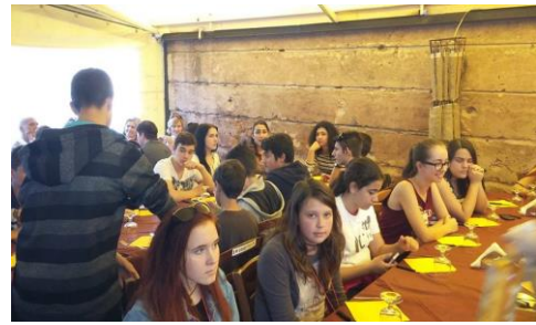
Med kosilom v centru Catanie.