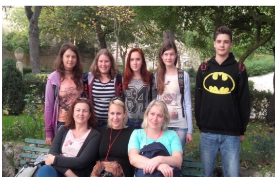
Slika z učiteljicami v parku v mestu Ibla Ragusa.

Zjutraj sem se zbudila okrog osme ure, saj smo se pred šolo zbrali šele ob 9.00. Vsi smo se zbrali pred šolo, kjer nas je pobral avtobus in nas odpeljal do farme, kjer izdelujejo sir in druge mlečne izdelke. Najprej smo si ogledali krave, kje jih imajo, koliko jih imajo in kako jih molzejo. Potem so nam pokazali, kako izdelujejo rikoto – sir. Na farmi smo imeli tudi kosilo. Po kosilu nas je avtobus odpeljal do zelo lepega in starega mesta Ibla Ragusa. Tu smo imeli ogled mesta. Ogledali smo si tudi park, ki je bil prečudovit, in cerkev. Po ogledu mesta smo se odpeljali nazaj v Catanio. Pred šolo smo se poslovili z učenci iz drugih držav, ki jih naslednji dan ne bomo več videli. Vse skupaj je bilo zelo žalostno, saj smo vedeli, da se z nekaterimi ne bomo več nikoli videli. Po dolgem poslavljanju smo odšli domov. Tam smo imeli večerjo in se pripravili na spanje. Seveda je bilo treba nekatere stvari tudi že spakirati v potovalko. Ta večer nismo odšli spat tako pozno.