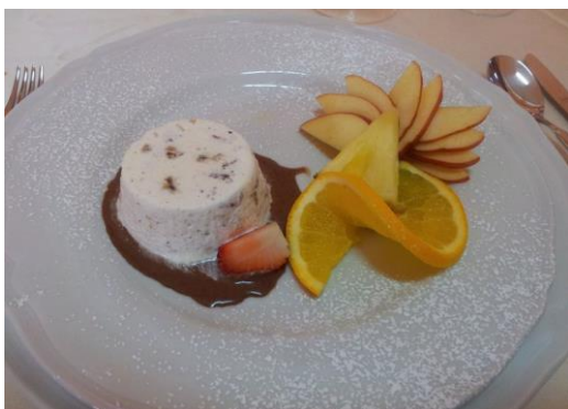
Sladica, ki smo jo dobili.

Zvečer so nas gostiteljske družine zopet peljale v nakupovalni center. Čeprav smo prišli domov okrog 22.15, smo spat odšli zelo pozno.