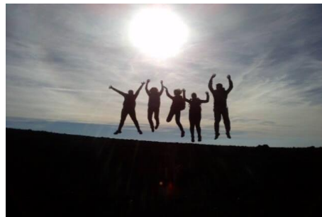
Skok na Etni.