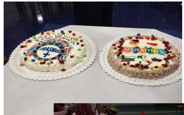
Torti, ki smo ju imeli za večerjo.

Zvečer smo imeli z vsemu učenci, ki so bili v Catanii na izmenjavi in z vsemi gostiteljskimi učenci večer bowlinga. Bilo je zelo zabavno in z vsemi smo se še bolj zblížali. Na bowlingu smo imeli tudi večerjo. Vsak je dobil za predjed pomfri, potem pa še vsak eno celo pico. Dvomim, da je kdo pojedel celo (razen seveda italijanskih učencev). Dobili smo tudi dve različni torti, na katerih je bil znak Erasmusa in zastave vse držav. Torti sta bili naravnost odlični. Spat smo odšli zelo pozno, saj smo se pozno vrnili tudi domov.