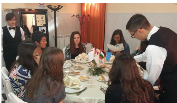
Kosilo na inštitutu.