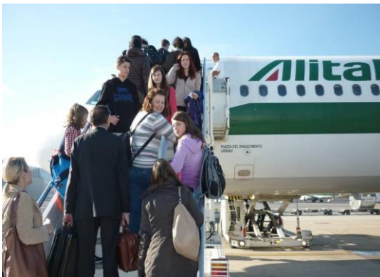
Počasi gremo na letalo.

Na Siciliji je bilo zelo lepo. A še lepše je, ko se vrneš nazaj v domače kraje.