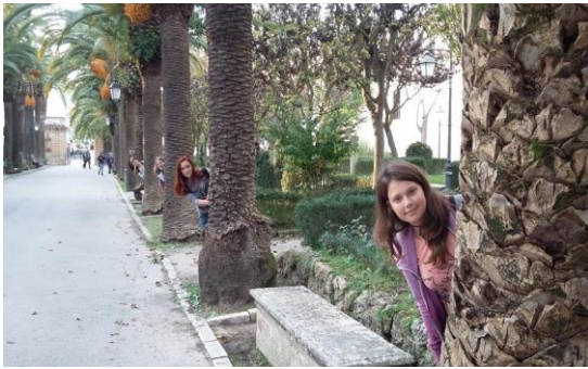
Skrivalnice v parku.