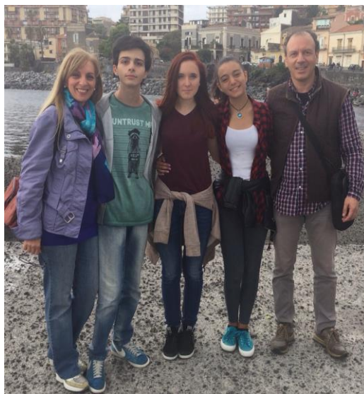
Na sliki smo jaz in moja gostiteljska družina.

Na tej sliki pa smo učenci in učiteljice, ki smo odšli na izmenjavo na Sicilijo.