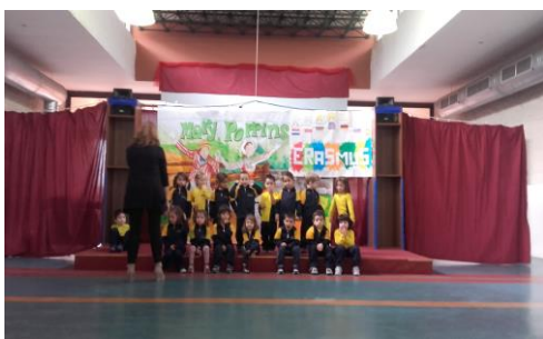
Najmlajši pojejo za nas.

Potem nas je avtobus odpeljal do lepega obmorskega mesta Acicastelo. Tu smo odšli na ruševine nekega gradu. Pogled na obalo ter na morje z gradu je bil nepopisljiv. Imeli smo zelo lepo vreme, zato je bilo vse skupaj še lepše. Od tu smo ob obali odšli do restavracije, kjer smo jedli kosilo. Za kosilo smo dobili pomfri in vsak svojo pico. Po kosilu smo odšli nazaj v šolo. Tam smo imeli 15 minut vaje z orkestrom, potem pa nastop. Ta nastop mi bo zagotovo za vedno ostal v spominu kot ena zelo dobra izkušnja. Po nastopu smo odšli domov in se pripravili za zabavo, ki so jo pripravili za nas. Ta ples je bil drugačen od tistih, ki jih prirejamo mi v šoli. Imeli smo koreografa – animatorja, za katerim smo vsi ponavljali plesne gibe. Bilo je zelo zabavno in imeli smo se super. Še bolj smo se zblížali z ostalimi učenci na izmenjavi.