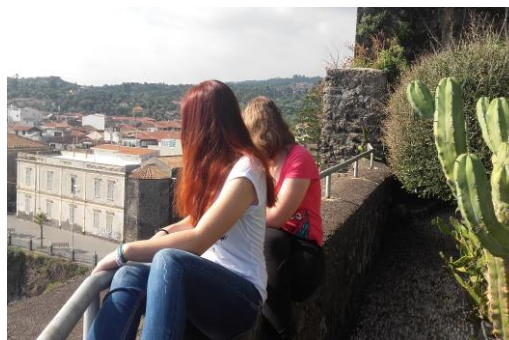
S Katarino gledava na staro mesto.