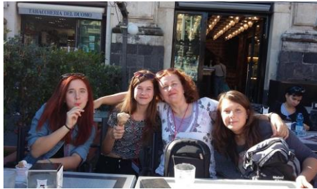
Na sladoledu v centru Catanie.