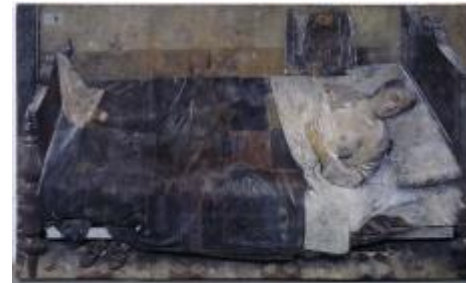
Mujer durmiendo (El Sueño), Antonio López, Tomelloso, Ciudad Real, 1963.