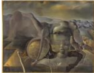
Dalí, Salvador , Endless Enigma (Enigma sin fin), 1938