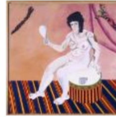
Arroyo, Eduardo, España te miró , 1967