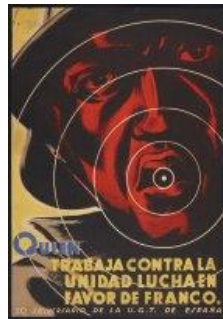
H. (Autor de cartel de la Guerra Civil), Quién trabaja contra la unidad lucha en favor de Franco 1938