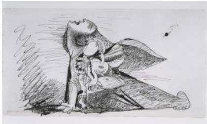
Picasso, Pablo (Pablo Ruiz Picasso)

Madre con niño muerto (I). Dibujo preparatorio para «Guernica» 1937 (9 de mayo, París)