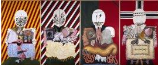
Arroyo, Eduardo, Los cuatro dictadores , 1963