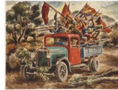
Molina García de Arias, Jesús , La España que no quieren conocer , 1937