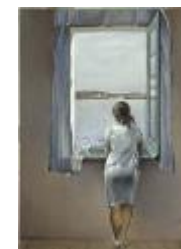
Dalí, Salvador Figura en una ventana, 1925