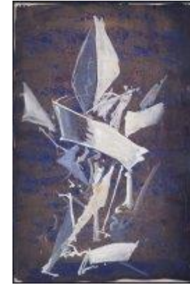
González de la Serna, Ismael

Composición abstracta. Homenaje a España, 1938