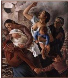
Ferrer, Horacio , Madrid 1937 (Aviones negros) 1937