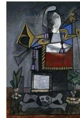
Picasso, Pablo (Pablo Ruiz Picasso)

Monument aux espagnols morts pour la France (Monumento a los españoles muertos por Francia) 1946-1947