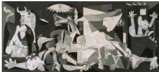
Picasso, Pablo (Pablo Ruiz Picasso) Guernica 1937 (1 de mayo-4 de junio, París)

Madre con niño muerto (I). Dibujo preparatorio para «Guernica» 1937 (9 de mayo, París)