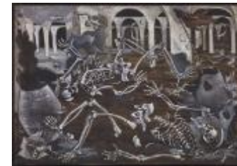
Mallo, Maruja (Ana María Gómez González) , Antro de fósiles, 1930