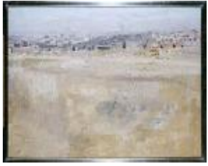
Madrid visto desde el cerro Tio Pio, Antonio López, 1962-63.