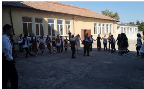
Ден 1 – Дейности в училище

с. Войводиново 4135, ул. „Христо Ботев“ № 51 тел. (03101) 22 31, http://ouvovodinovo.com/