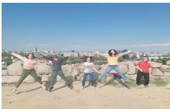
ДЕН 2 – Ориентиране в Пловдив

Уникално беше и преживяването в София на третия ден от престоя. Посетихме интерактивния музей "Музейко", където учители и ученици изживяха емоцията на пътуване във времето – минало, бъдеще и настояще. Музеят предлага интерактивни игри, докосване до всички експозиции, изпробване на множество инструменти и други интересни занимания. Всички бяха изключително впечатлени и научиха много за природните стихии, богатствата на планетата, растителния и животинския свят, космоса и технологиите.