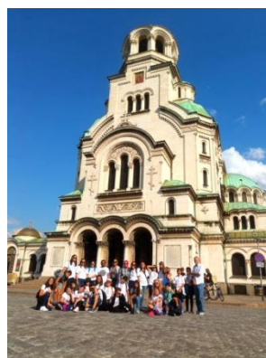
ДЕН 3 - София

През четвъртия ден програмата беше вълнуваща и динамична с посещение на природонаучния музей в град Пловдив. Там също наблюдавахме прожекция в планетариума и по един незабравим начин се докоснахме до процесите в космоса и виртуално посетихме планетите. Вникнахме в историята на един от символите на града - Римският стадион, където гледахме 3D филм за миналото на стадиона и популярните състезания през вековете! Бяха подготвени две визити на училища в град Пловдив, а именно “ Душо Хаджидеков” и Националната Гимназия по Сценични Кадри, за да предоставим възможност на нашите чуждестранни партньори да се потопят в духа на българското образование, да се запознаят с методиката на работа и обучение, обмяна на опит с колеги, а учениците да създават приятелства и дълготрайни контакти.