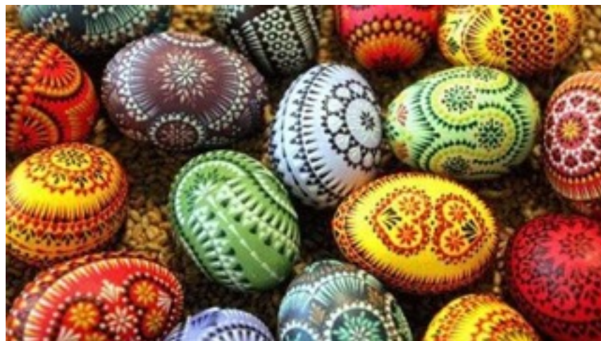
Dates de Pâques 2000-2040 Calendrier grégorien