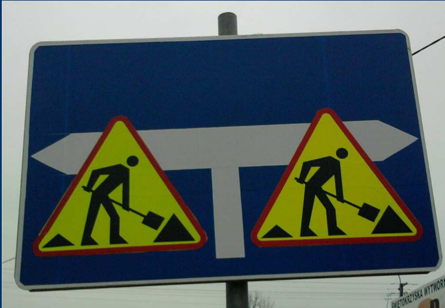
A ROAD SIGNTOWER – RECTANGLE / ZNAK DROGOWY – PROSTOKĄT