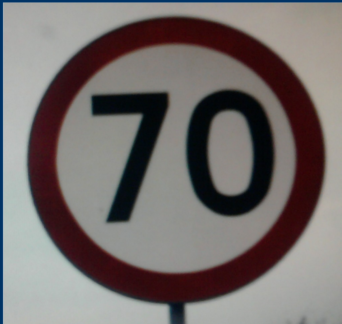
A ROAD SIGN – WHEEL / ZNAK DROGOWY – KOŁO