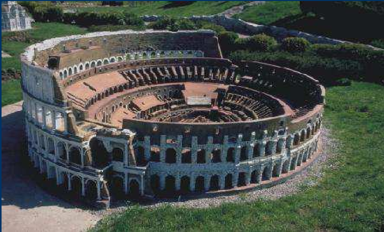
COLOSSEUM – ELLIPSE / KOLOSEUM – ELIPSA