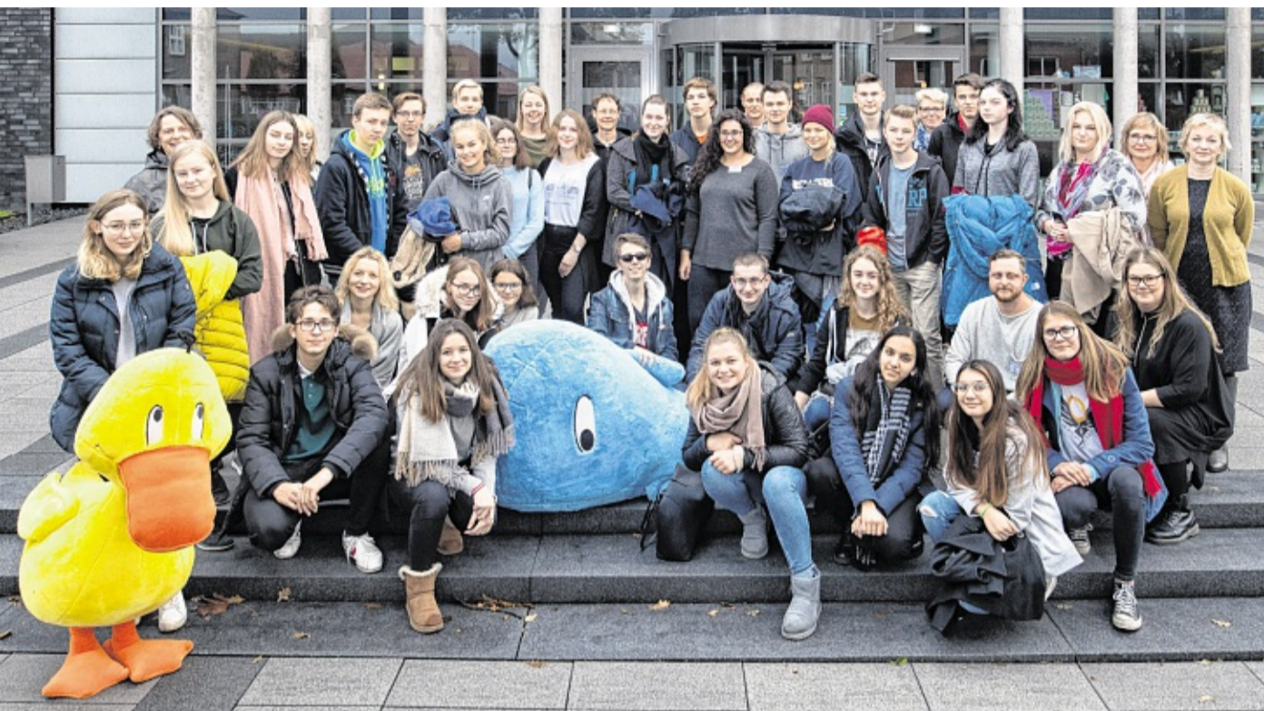
30 Schüler und zehn Lehrer aus fünf Ländern rund um die Ostsee finden im europäischen Erasmus-Projekt neue Freunde, diskutieren politische Themen und lernen bei Piet und Paula im sh:z-Medienhaus, wie eine Zeitung in Deutschland arbeitet. MARCUS DEWANGER

„Ich habe mich für das Projekt beworben, damit ich neue Menschen aus anderen Ländern kennenlernen“, sagt Maja. Die 15-Jährige kommt aus der schwedischen Stadt Uppsala, die nördlich von der Hauptstadt Stockholm liegt. Doch es geht nicht nur darum, andere zu treffen. Die Jugendlichen diskutieren auch gemeinsam über die Themen Meinungsfreiheit und Gleichberechtigung von Frauen