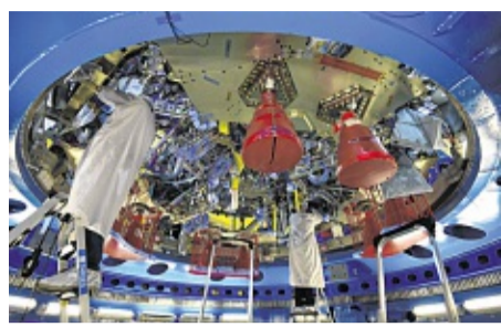
Das Raumschiff Orion wird gerade noch gebaut. CARMEN JASPERSEN

BREMEN Kennst du Orion? Vielleicht noch nicht. Es ist ein Raumschiff, von dem du wohl noch öfter hören wirst. Orion wird gerade gebaut und soll in einigen Jahren ganz weit ins All fliegen – bis hinter den Mond. Dort waren Menschen noch nie. Auf dem Mond waren Raumfahrer zwar schon, aber eben noch nicht dahinter.