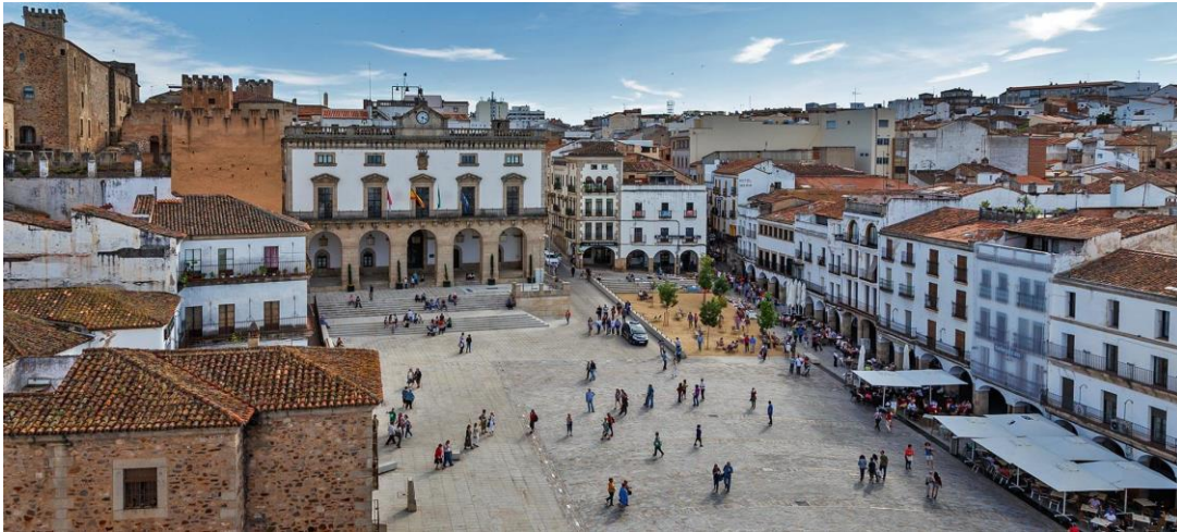
Grand place de Càceres