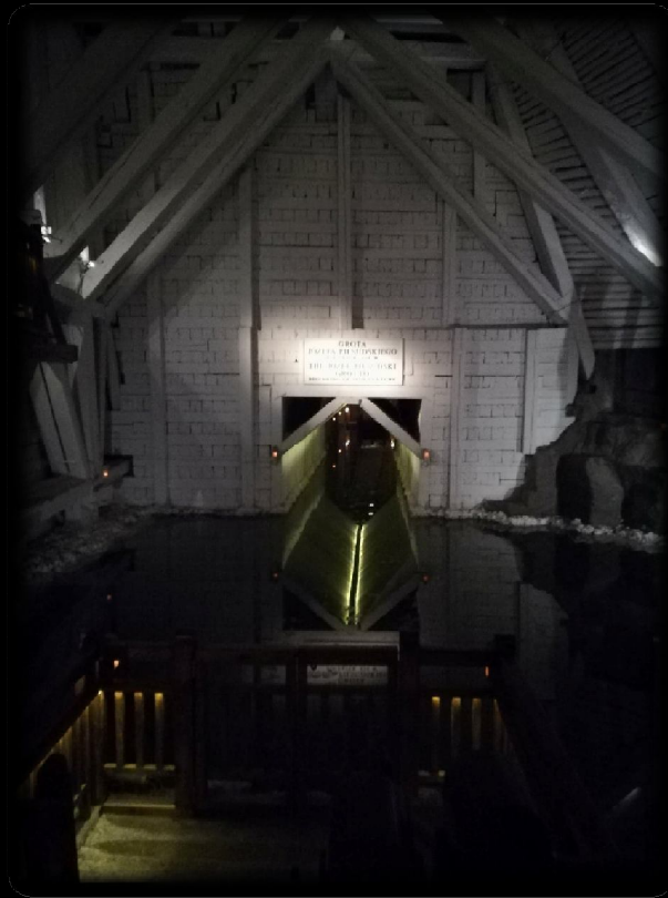
Józef Piłsudski's grotto