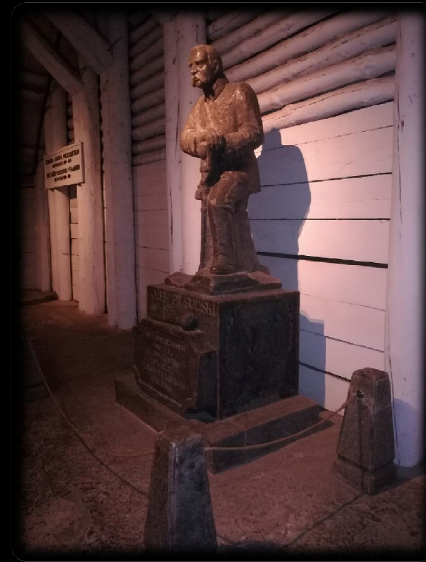
Józef Piłsudski's denkmal