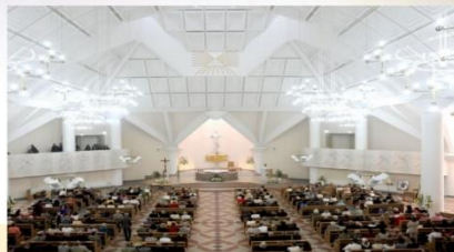
Elektrėnų Švč. Mergelės Marijos Kankinių Karalienės bažnyčia