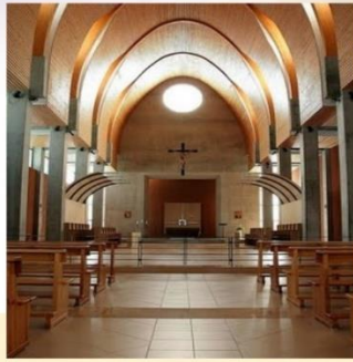
Palendrių benediktinų vienuolynas