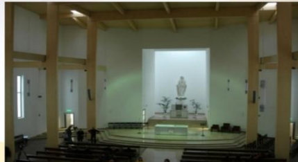
Siaulių Švč. Mergelės Marijos Nekaltojo prasidėjimo bažnyčia