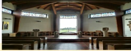
Pranciškonų vienuolyno koplyčia prie Kryžių kalno