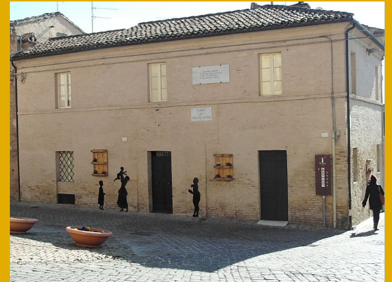
Casa de Silvia