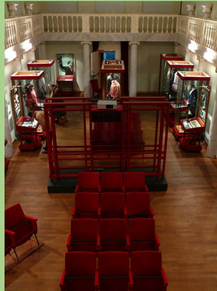
Museo Beniamino Gigli