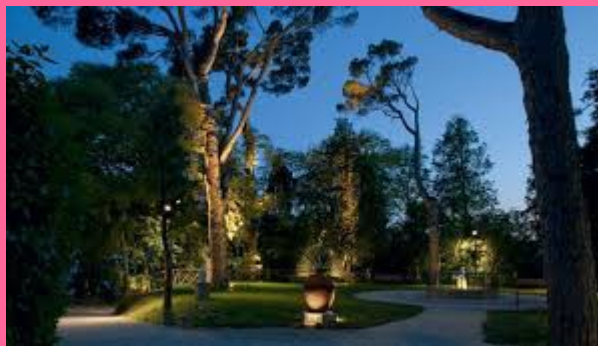
Parque Villa Coloredo