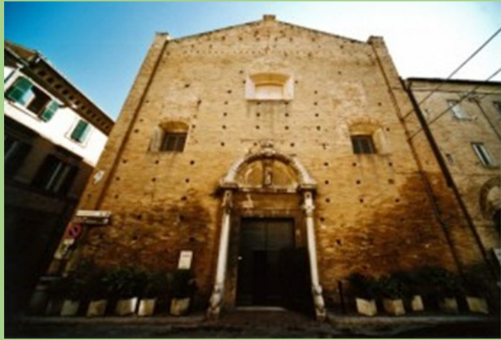
Iglesia de Sant'Agostino