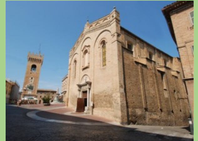
Iglesia de San Domenico