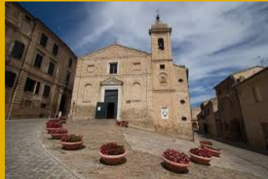
Iglesia de Santa Maria de Montemorello