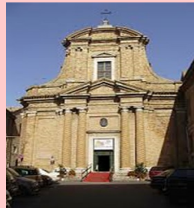
Iglesia de San Vito