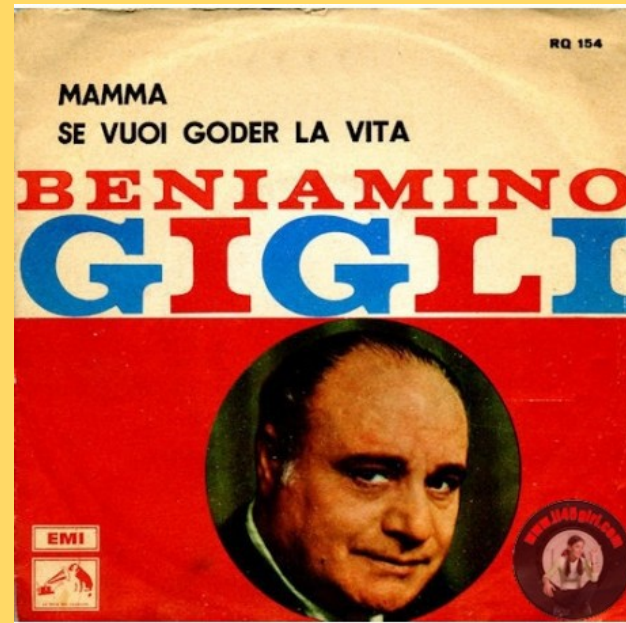
El disco " Mamma "