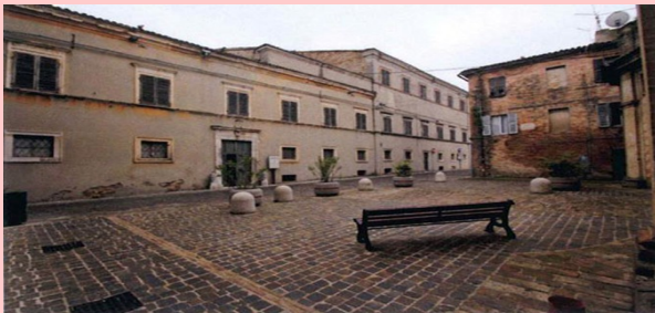
Casa de Adelaide Antici

Por la calle que conduce a la plaza principal se puede encontrar la casa de Adelaide Antici, madre de Giacomo Leopardi, la iglesia de San Vito, donde Leopardi leía sus oraciones religiosas, la iglesia de San Agostino, de cuyo claustro se admira "la Torre del Passero Solitario" que es el campanario de la iglesia y por último el teatro Persiani, de 1840, que alberga el museo de Beniamino Gigli. La plaza Giacomo Leopardi, construida a finales del XIX siglo con ocasión del primer centenario del nacimiento de Leopardi, alberga la Torre del Borgo (alta 36 metros) del XIV siglo, el Ayuntamiento ( del XIX siglo) y la iglesia de San Domenico ( originalmente románica).