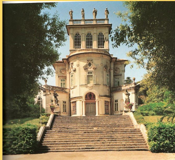
Su residencia en Porto Recanati