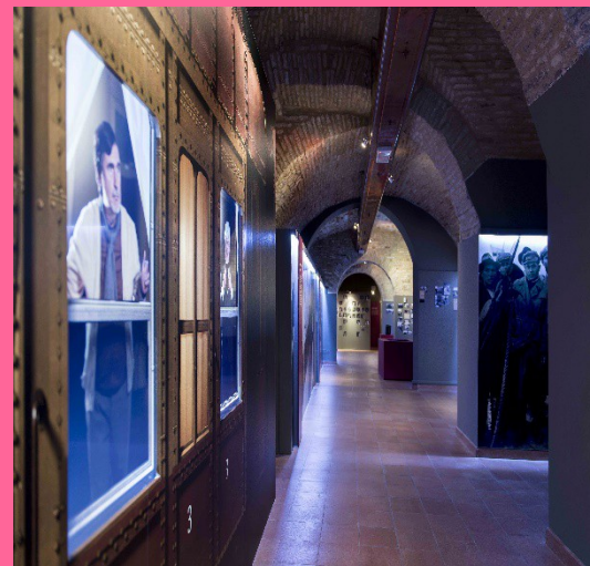
Museo de la emigración