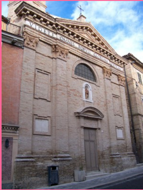
Iglesia de Sant'Anna