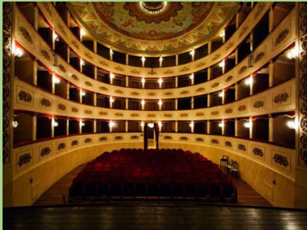
Interior del teatro