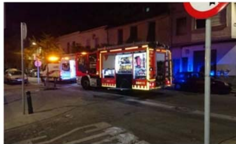
Los bomberos en la vivienda incendiada.

• El hombre de 43 años que resultó herido en la madrugada de este viernes con quemaduras de tercer grado en más del 80% de su cuerpo