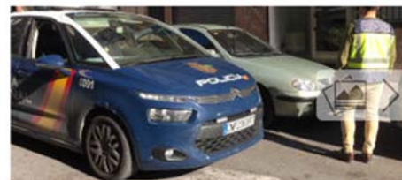
Detienen a dos personas por robar en una ONG de Elche

Los hechos tuvieron lugar a mediados de junio del año pasado, cuando al parecer dos personas accedieron al recinto de una institución privada, dedicada a la ayuda de personas sin recursos, que se encuentra ubicada en el barrio de Carrús en la ciudad de Elche, para sustraer multitud de mercancía, dispuesta para ser entregada en el ámbito de la labor social que dirige la entidad.