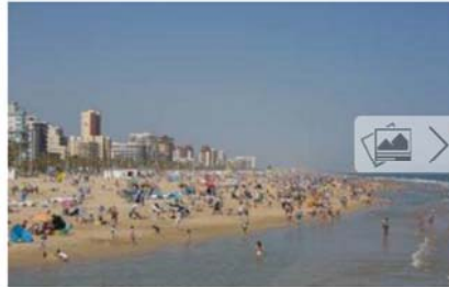
Crece el gasto de los turistas que visitan Gandia en Semana

La ocupación hotelera la pasada Semana Santa fue prácticamente del 100%, unas cifras que desde el sector ven de forma muy positiva, sobre todo de cara a afrontar la campaña veraniega.