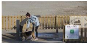
Castelló cerrarà este sábado su playa canina y estudiará mejoras para octubre

Seis meses que quizás saben a poco pero que han sido un gran avance para los propietarios de perros de la capital de la Plana. Tras su apertura a mediados del pasado mes de octubre, la playa canina del Grau de Castelló cerrará sus accesos a los canes a partir de este sábado 1 de abril, tal y como estaba previsto en la puesta en marcha de un proyecto piloto «que podemos valorar en términos generales como positivo».