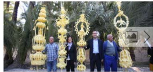
Elche envía sus palmas blancas al Papa y los Reyes de España

Elche envía este miércoles al Papa Francisco , a los Reyes de España , al presidente del Gobierno de España y al presidente de la Generalitat, así como al obispo de la Diócesis Orihuela-Alicante, las tradicionales palmas blancas con las que cada año obsequia a las principales actores eclesíasticos y políticos con vistas a la procesión del Domingo de Ramos.