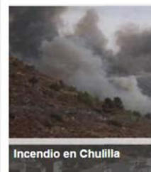
Incendio en Chulilla

Ara, després de veure l'incendi des de lluny, vaig cap a la Plana d'Utiel on estaré a Requena. Allí provaré els famosos bollos de Requena, que és coca salada de llonganissa i pernil.