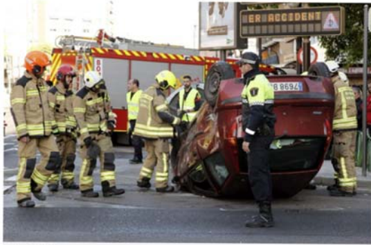
La unidad de bomberos junto a uno de los tres vehículos implicados en el accidente múltiple en la ciudad de Valencia, que se ha saldado con tres heridos leves.

El siniestro ha tenido lugar en el cruce de esta avenida con las calles Lorca y Archiduque Carlos