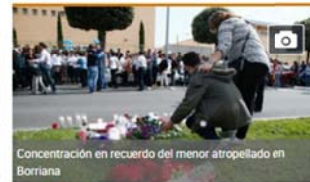
Concentración en recuerdo del menor atropellado en Borriana