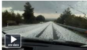
El granizo en Utiel.

Antes de la llegada de la tormenta a Utiel, la temperatura era de 25.1°C. Poco más de media