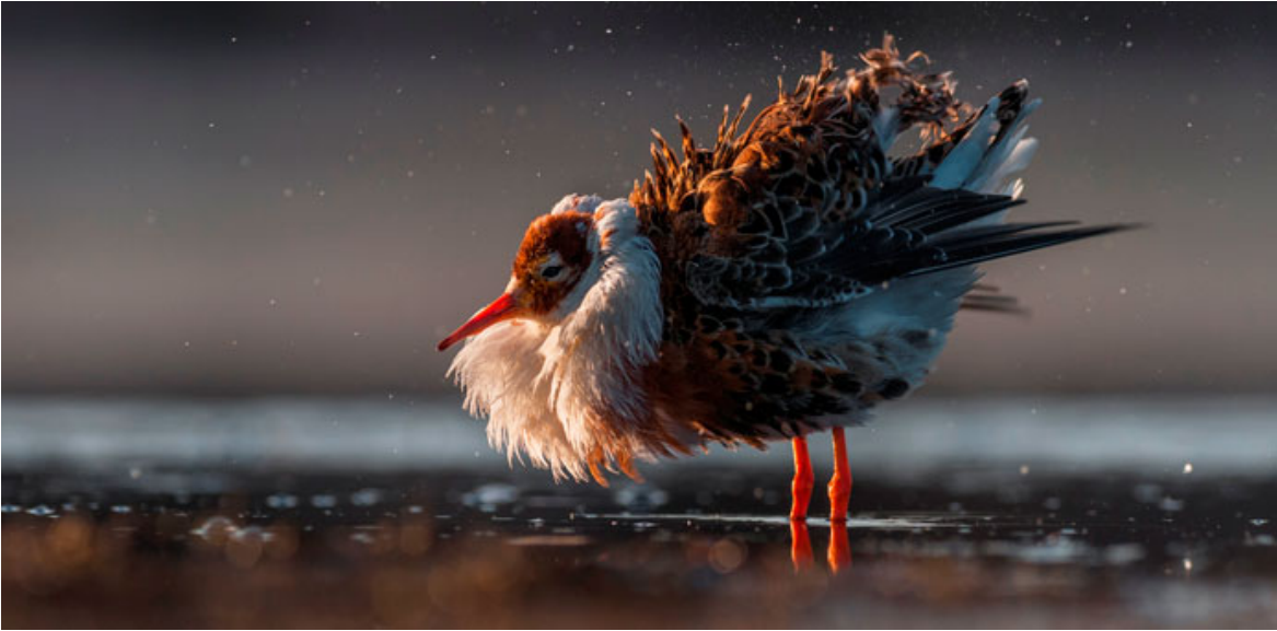
Jimi class 6