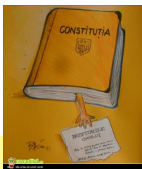
Drepturile fundamentale cetatenesti .

Drepturile omului sunt "de obicei înțelese ca drepturi inalienabile fundamentale la care o persoană are în mod inerent dreptul pur și simplu pentru că el sau ea este o ființă umană." [1]. Drepturile omului sunt astfel considerate ca fiind universale (se aplică peste tot) și egalitare (aceleași pentru toți). Aceste drepturi pot exista ca drepturi naturale sau ca drepturi legale, atât în legislația națională și internațională. [2]. Doctrina drepturilor omului în practica internațională, în cadrul dreptului internațional, instituțiile globale și regionale, în politicile de state și de activitățile de organizații non-guvernamentale a fost o piatră de temelie a politicilor publice din întreaga