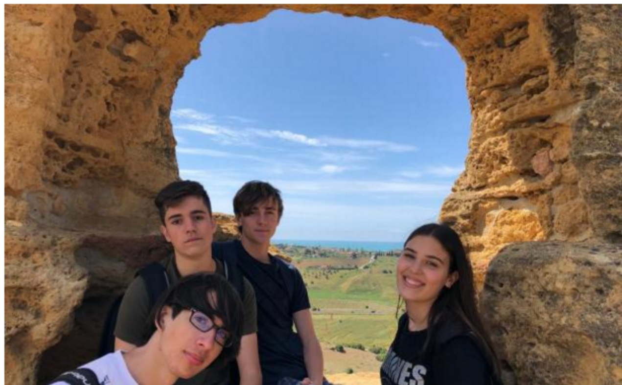
El grupo de estudiantes, en Agrigento.

En el programa, en el que participan escuelas de Italia,