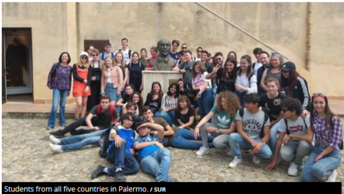
Students from all five countries in Palermo.