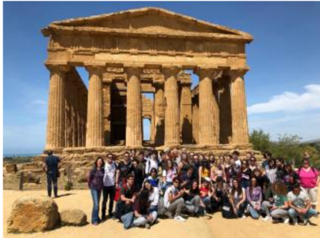
Alumnos y profesores, en una de las visitas en Palermo L.O.

Las actividades tuvieron lugar en el instituto Liceo Classico Vittorio Emanuele II en Palermo (Italia) y participaron otras escuelas europeas de Truro en Inglaterra , Tampere en Finlandia , Achim en Alemania y Vukovar en Croacia .