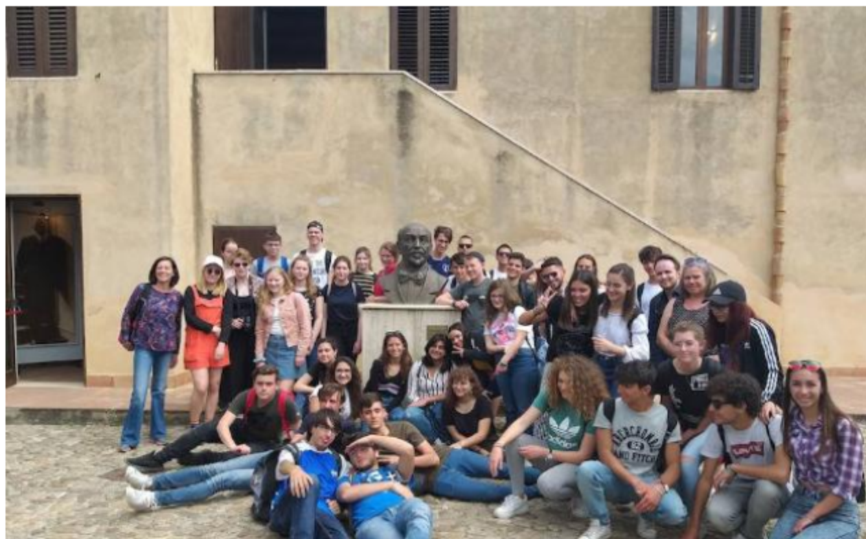
Todo el grupo de alumnos erasmus, en la casa museo Luigi Pirandello.

Commemorar la semana en Palermo. Finalmente, se entregaron premios a las mejores poesías, se realizó la evaluación de la semana y disfrutaron de una feria de gastronomía italiana.