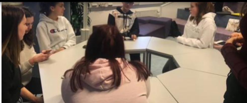
At work in Finland. / SUR

Earlier this year students from all five countries, including a group from Huelin, got together in Tampere, Finland, on the second leg of the project.