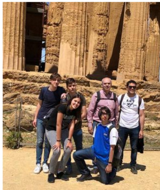
The group from IES Huelin.