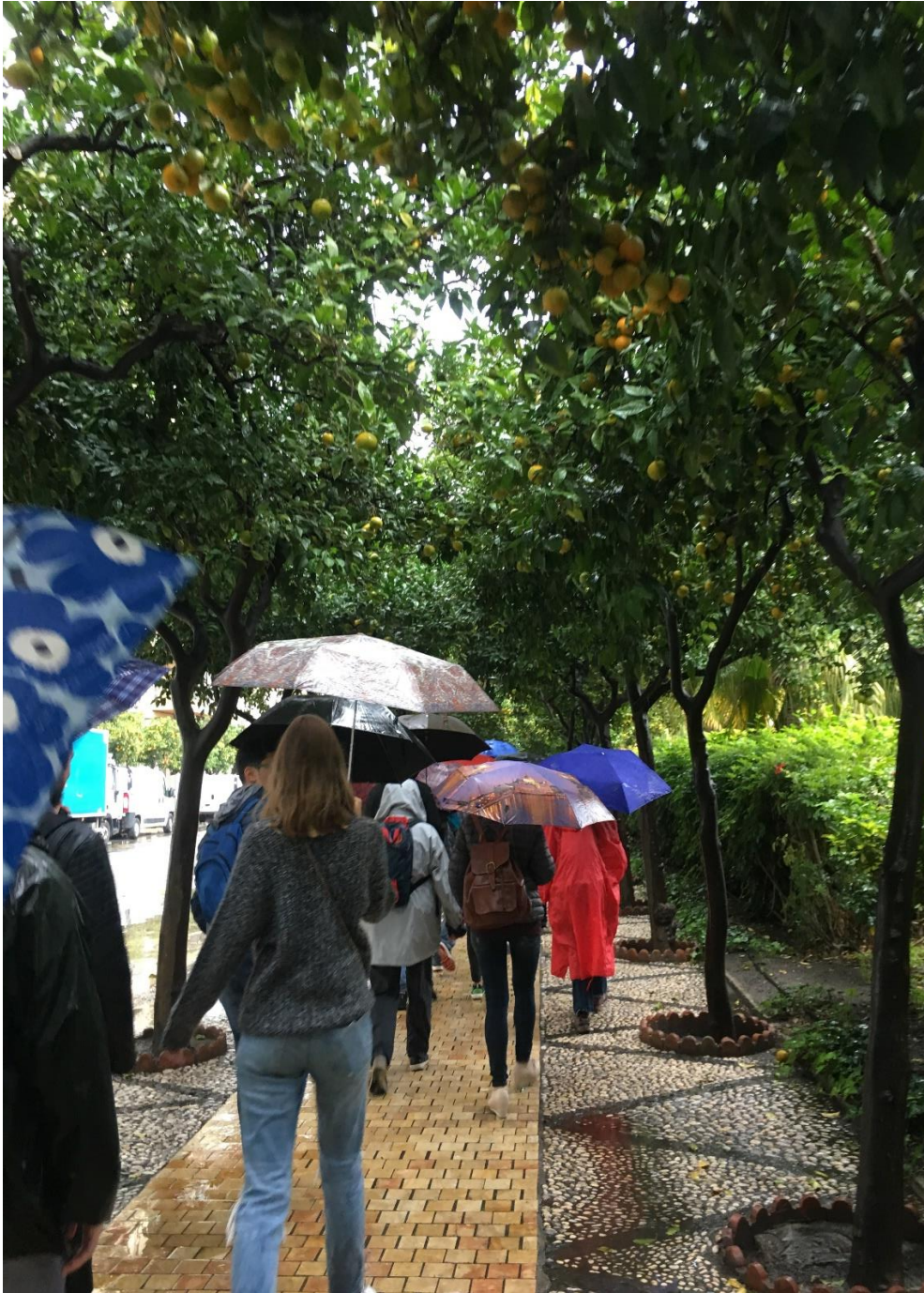
Kuvassa olemme matkalla Malaga-museolle.

Päivä lähti käyntiin aamulla puoli kymmenen aikaan paikalliselta koululta, josta sitten lähdimme kävelemään yhdessä Malagan museolle. Matkan varrella keräsimme opettajatkin matkaan hotellilta.