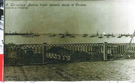
Torreveja. Bahía. Vista tomada desde el Casino.

El casino es un centro de reuniones serio pero por sus... Además de café, hay un restaurante aquí si o toda esta talla es obra del artista murciano D. Fernique Alvaroz Solera. Los preciosos pintores son debidos al famoso maestro Matina Viza. La taquilla en Torreveja fue desada por D. Manuel ati.