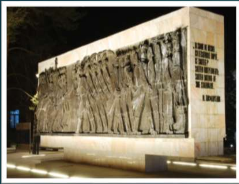
Monument de l'Indépendance

C'est celui qui domine le marché. Il s'agit d'un bas-relief en bronze révélé en 1977 et commémorant cent ans d'indépendance. Il montre des scènes de bataille et des visages de soldats.