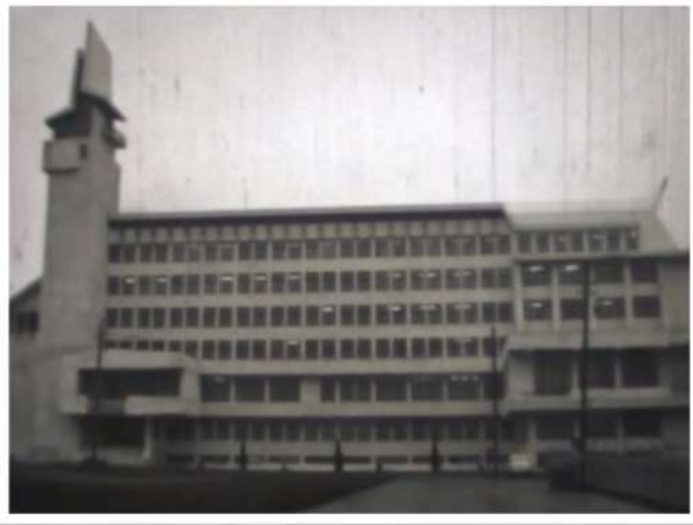
Le palais administratif Vaslui

Le palais administratif est un bâtiment qui abrite la préfecture et le conseil de comté. C'est un vieil édifice dont le balcon, à l'ère du communisme, s'adressait à la foule "le souverain bien-aimé".