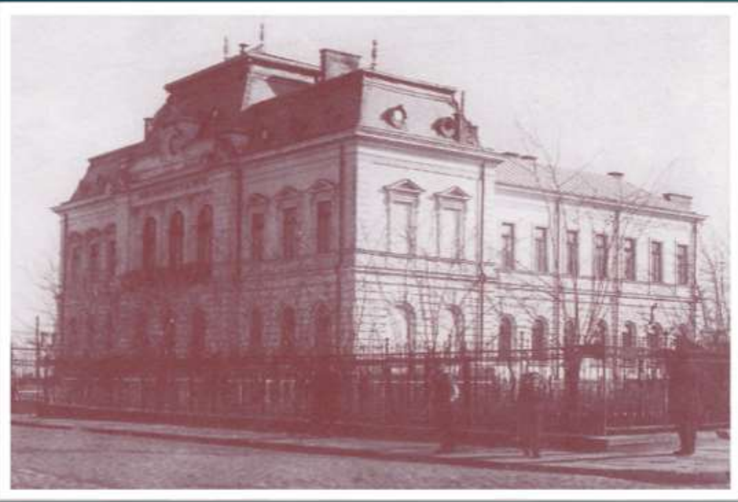
Palais administratif et de justice de Vaslui (début du XXe siècle)