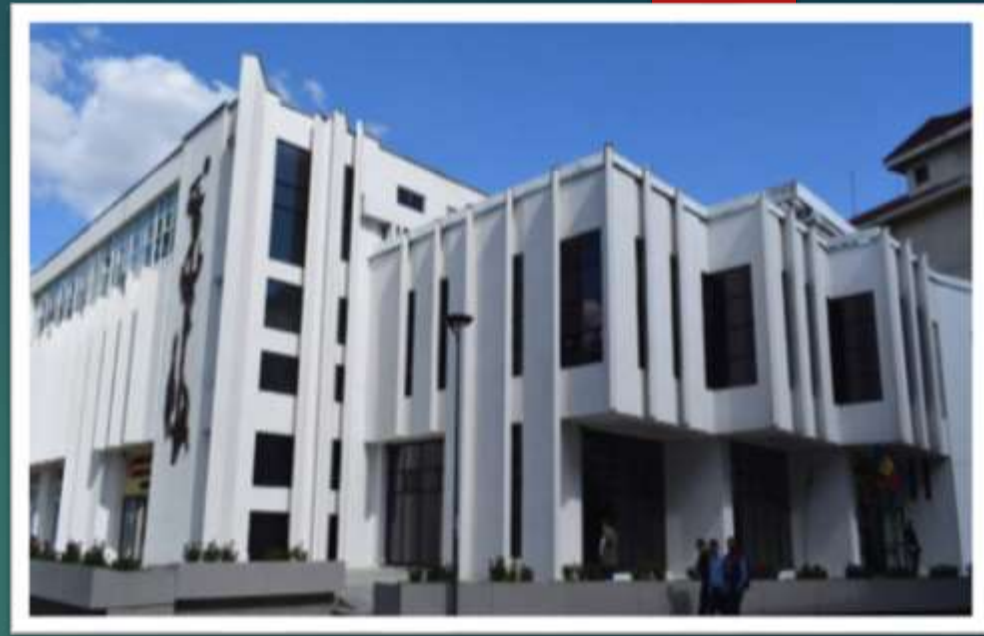
Musée du département Vaslui

Le musée du département Stefan cel Mare, un lieu chargé d'histoire et d'émotion, est situé sur la place de l'Indépendance. On y trouve des vestiges qui témoignent de la vieillesse de la ville, ainsi que des noms et des réalisations des personnalités qui représentent avec fierté Vaslui.