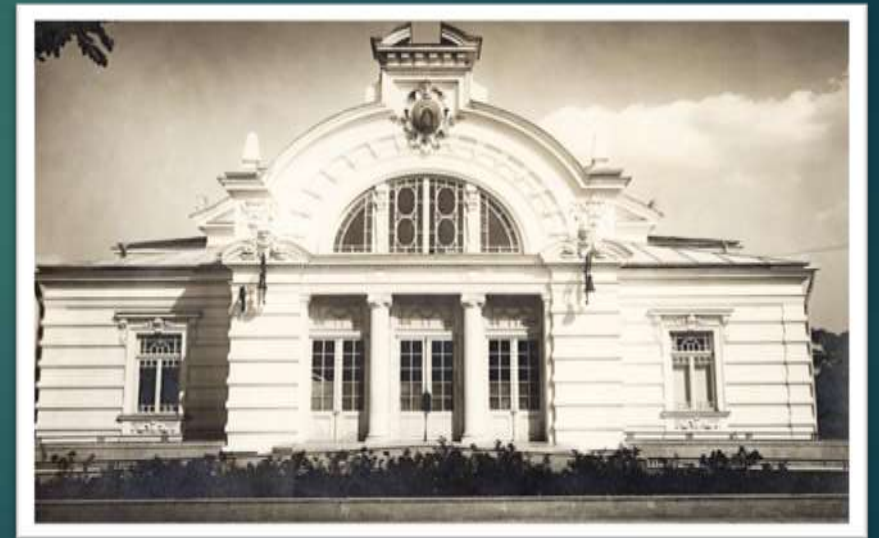
Théâtre Vaslui dans les années 1950

Independence Square relie le passé au présent. Voici le palais de justice, un très bel ancien bâtiment et la mairie de Vaslui, un bâtiment moderne de notre époque, le tout entouré de verdure et de fleurs.