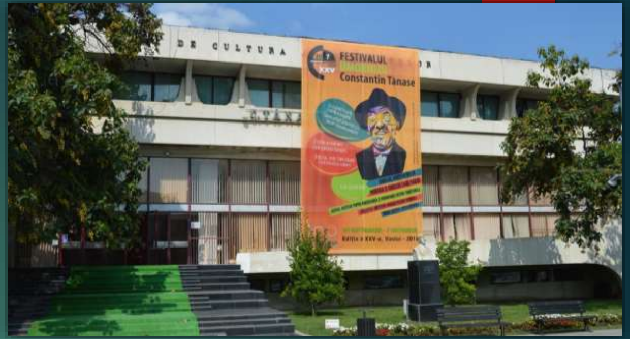
Maison de la culture Vaslui

Au devant le bâtiment se trouve le buste de l'acteur qui "patronne" le festival qui porte son nom et qui se déroule depuis 1970, le festival bi-annuel. C'est un festival de théâtre comique qui accueille, année après année, des noms célèbres d'acteurs de théâtre roumains.