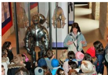
Au musée, la guide nous a présenté une armure utilisée durant les tournois des chevaliers.