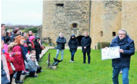
L'apprenti guide nous a montré les anciennes armes utilisées dans le château.