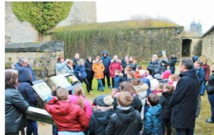
Nous avons vu et reconstitué les différents blasons des familles qui ont vécu dans le château.