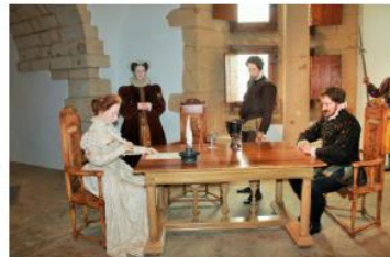
Nous avons assisté à la reconstitution du mariage de la princesse Charlotte de la Marck.