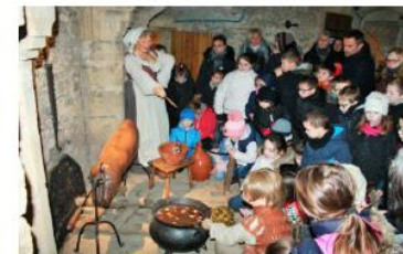
Une cuisinière gronde l'enfant parce qu'il préfère jouer avec le chat plutôt que de l'aider à préparer la soupe.