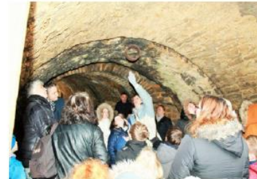
La guide explique le fonctionnement et l'utilité de la herse dans ses moindres détails.

A noter que ce voyage s'inscrit dans le projet Erasmus+ dans lequel l'école est engagée. La subvention obtenue a permis de diminuer de façon très importante le coût de la sortie.