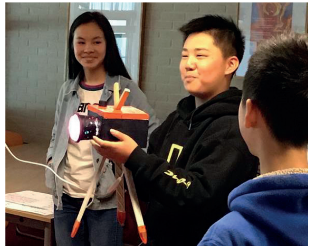
De winnende upcycling design lamp.

De indrukwekkende en creatieve designlampen die de leerlingen hebben gemaakt van afvalmaterialen zijn tentoongesteld in onze personeelskamer en onze onafhankelijk medewerkers konden via een lijst hun stem uitbrengen op een van de lampen. In april 2020 zullen onze 24 uitwisselingsleerlingen een tegenbezoek brengen aan deze school in Shanghai.