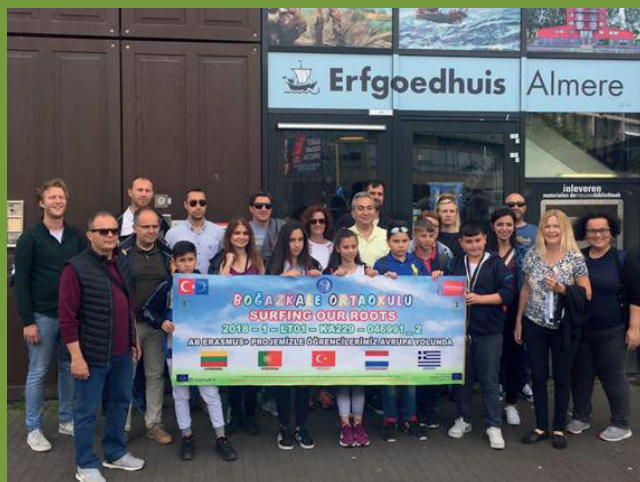
Bezoek aan het Erfgoedhuis in Almere Buiten

Na ons bezoek aan Portugal in maart 2019 was nu onze school aan de beurt om een inspirerend programma aan te bieden in het kader van culturele en werelderfgoederen. Gedurende een week hebben leerlingen en docenten onderzoek gedaan, activiteiten verricht en samengewerkt in het door Europa gefinancierde Erasmus-project Surfing Our Roots.