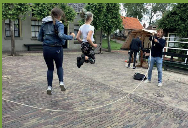
Bij de touwslager mag natuurlijk touwtje springen niet ontbreken.

De deelnemende scholen uit Turkije (Hatay en Çorum), Litouwen, Griekenland en Portugal hebben in deze week samen met onze leerlingen van de talentklas IAM en docenten een bezoek gebracht aan Amsterdam, Almere, Lauwersoog, de Waddenzee, Pieterburen, Enkhuizen, Bataviahaven en de Oostvaardersplassen.