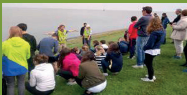
Werelderfgoed: de Waddenzee (hier uitleg door de Natuurschool)

De leerlingen verbleven in gastgezinnen van onze school. Hierdoor zijn ook de communicatievaardigheden versterkt en is er meer begrip ontstaan tussen de verschillende culturen en identiteiten.