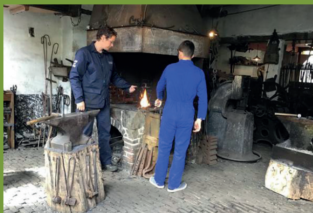
Hier wordt samengewerkt door onze leerlingen in het Enkhuizermuseum. Veel vraag was er hier voor werken bij de smid, waarbij deze Portugese leerling zelf het ijzer mocht smeden!

De deelnemende scholen uit Turkije (Hatay en Çorum), Litouwen, Griekenland en Portugal hebben in deze week samen met onze leerlingen van de talentklas IAM en docenten een bezoek gebracht aan Amsterdam, Almere, Lauwersoog, de Waddenzee, Pieterburen, Enkhuizen, Bataviahaven en de Oostvaardersplassen.