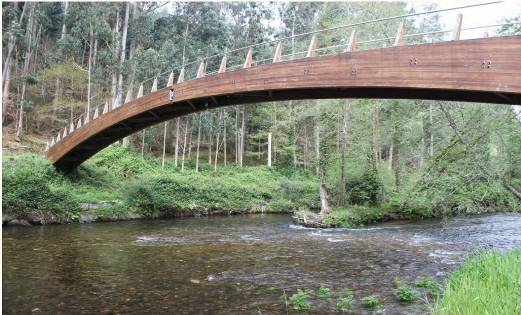
-Lugar onde se celebra a romería do Naseiro.

•Tamén son moi habituais as romerías a carón do río Landro, por exemplo a do val de Naseiro.