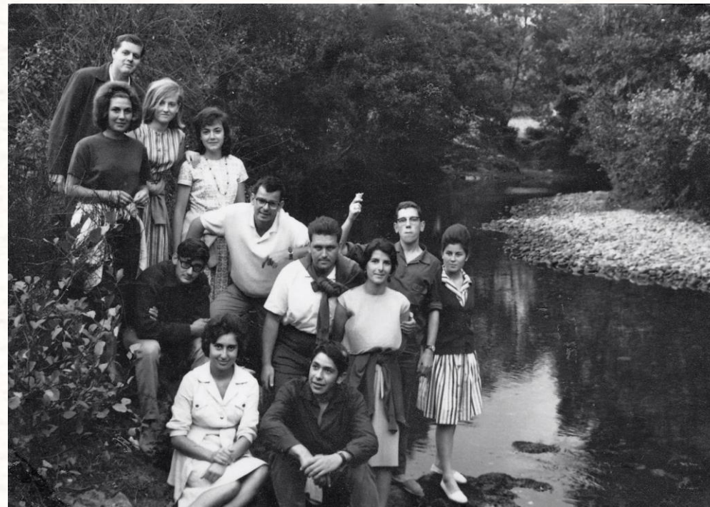
-Fotografía antiga na romaría