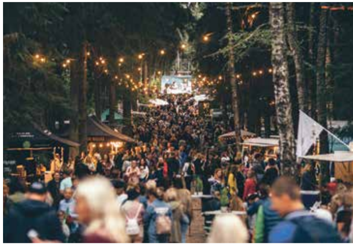
Intsikurmu 2021 festivalil kehtivad 2019. ja 2020. aasta edasilükatud festivali piletid, välja arvatud kasutamata telefestivali piletid.

Festivalile saab sel aastal soetada ainult kahepäevapileteid ning neid on müügis veel pisut vähem kui 1500.