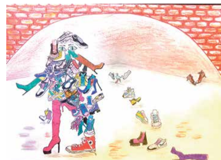
Hanna Juhkami jalatsivaim, 1 koht 7.-9. klassi arvestuses