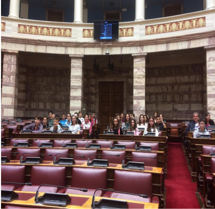
The Greek Parliament