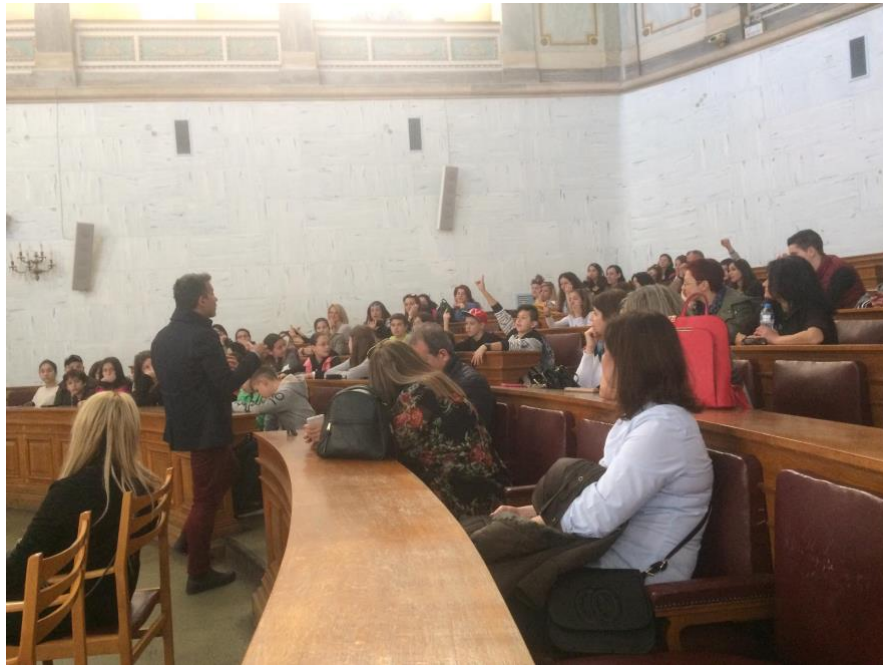
The Old Parliament