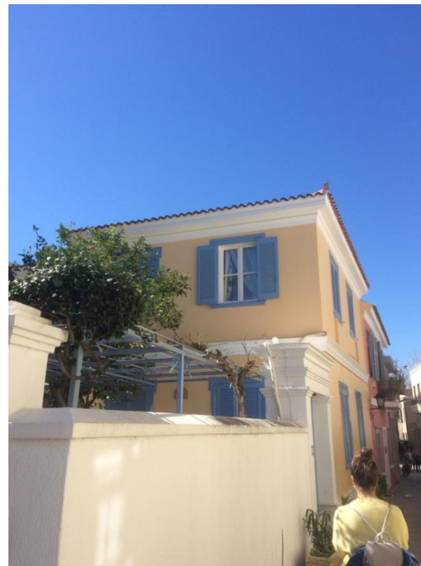
“Plaka” – Historical Center of Athens