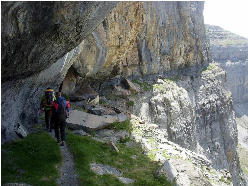
Faja des fleurs (Ordesa)

C'est le plus haut massif calcaire d'Europe. Il est situé sur le versant sud des Pyrénées centrales, au nord de la province de Huesca, dans le parc national d'Ordesa et Monte Perdido, dans la communauté autonome d'Aragon, en Espagne. Son sommet le plus élevé est Monte Perdido , à une altitude de 3355 mètres.